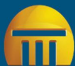
Pagamentos Ano a Ano