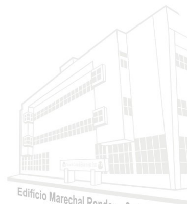
Edifício Marechal Rondon - Sede atual 2013