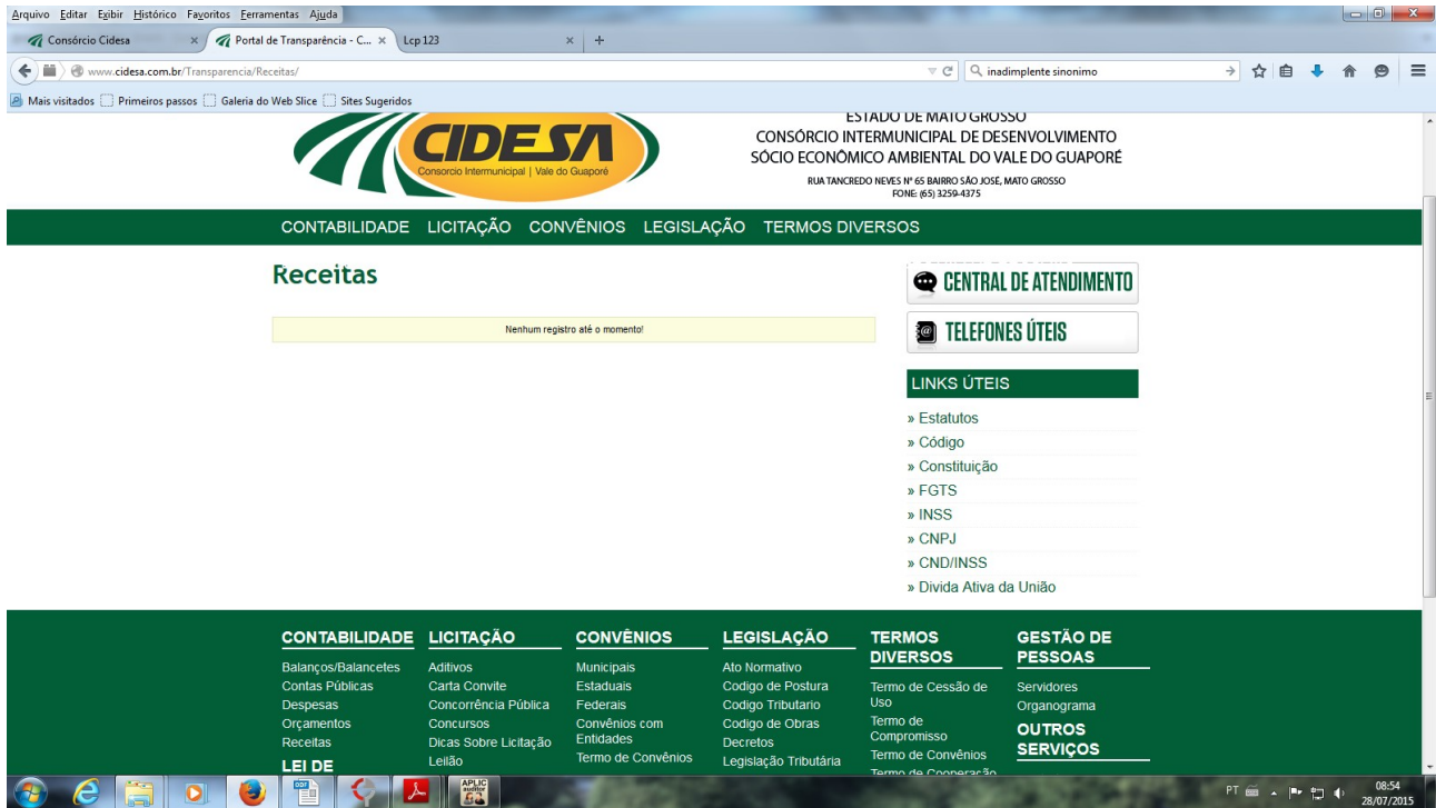
Figura 1. Situação da disponibilidade das receitas do Consórcio no site em 28/7/2015

Mensagem: Nenhum registro até o momento!