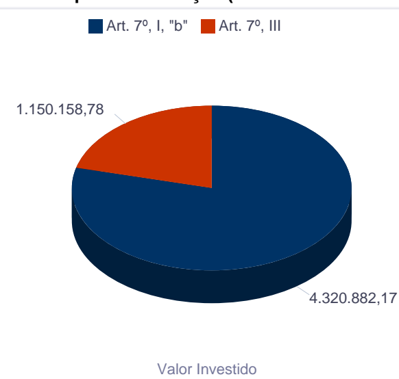
Valor Investido por Classificação (Res. CMN 3922/2010)

Valor Investido 5.471.040,95 Anexo XIV 5.471.040,96 Variação -0,01