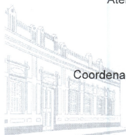
Casa Barão de Melgaço - 1ª Sede 1953