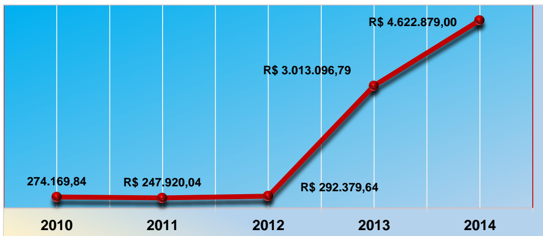
Gráfico 1 – Valores Recebidos a Títulos de “Encargos Oscip” de 2010 a 2014