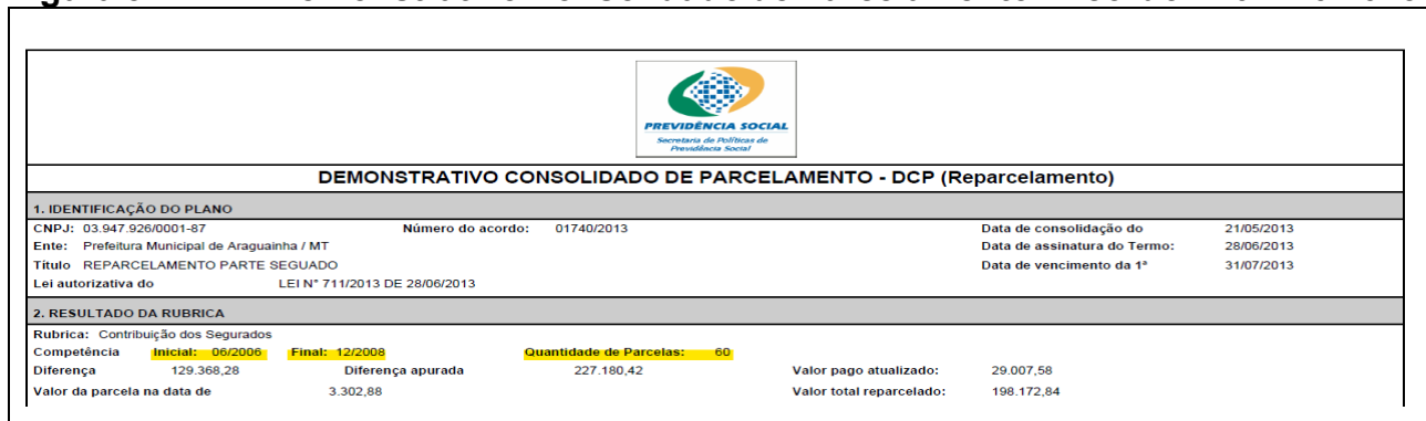
Figura 5 - DCP - Demonstrativo Consolidado de Parcelamento - Acordo nº 01740/2013: