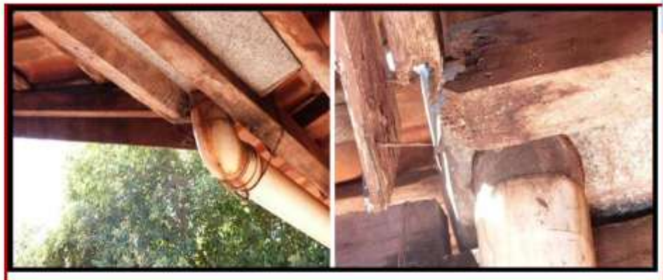
Figura 01: fotos do Telhado Existente para o contrato 344/2012