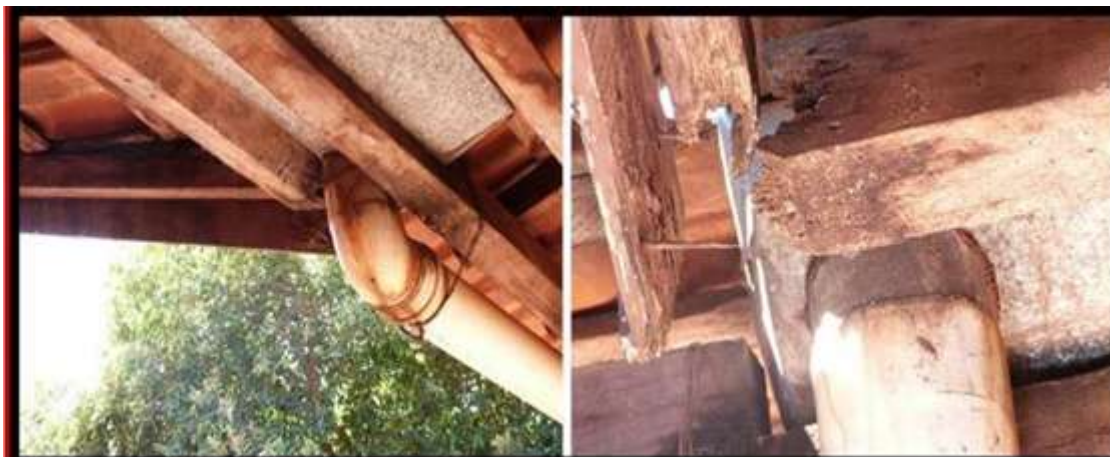
Figura 003: Madeiramento encontrado na Vistoria in LOCO

Nestes termos, ainda que de fato a Fiscal apenas tenha medido os itens executados, não poderia ter dado um recebimento definitivo para obras inacabadas e/ou ainda com essas pendências, nem mesmo ter feita a medição com itens inexecutados satisfatoriamente.