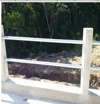
Guarda-corpo executado em face do contrato nº 009/2012/SECOPA