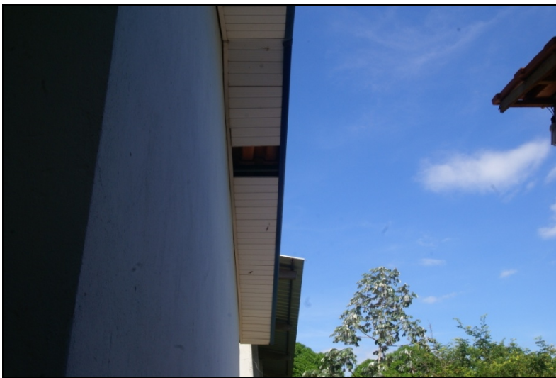
Forro de PVC não reparado