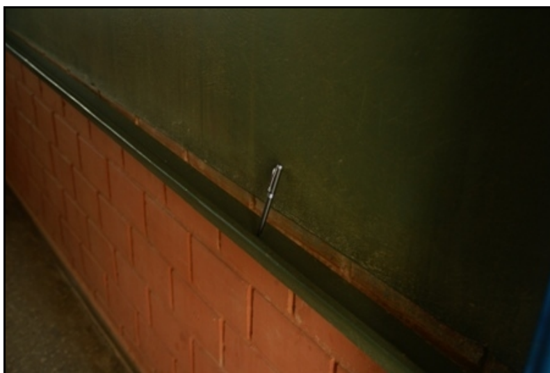
Quadro negro não recuperado, com o porta-giz danificado.