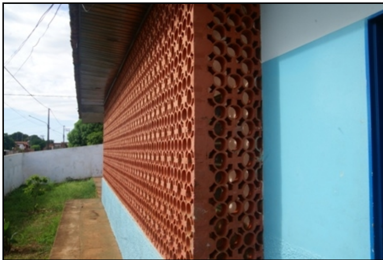
Elemento vazado não demolido

2.3.4) As fotos a seguir melhor ilustram o observado durante a inspeção: