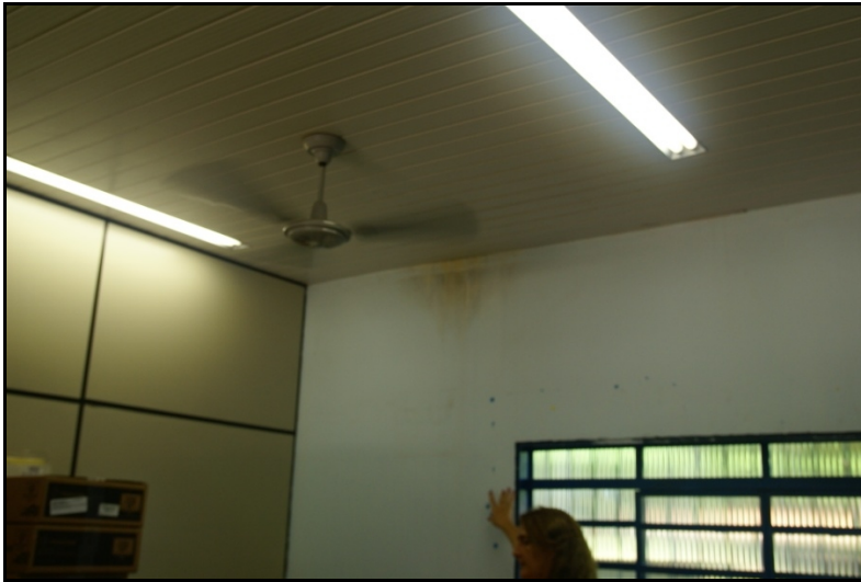
Goteira (umidade na parede próxima do forro de PVC)

2.4.4) As fotos a seguir melhor ilustram o observado durante a inspeção: