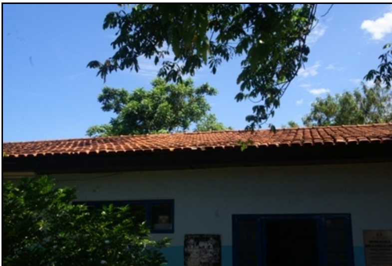
Vista parcial da cobertura da creche, não reparada, apresentando goteiras.

2.1.4) As fotos a seguir melhor ilustram o observado durante a inspeção: