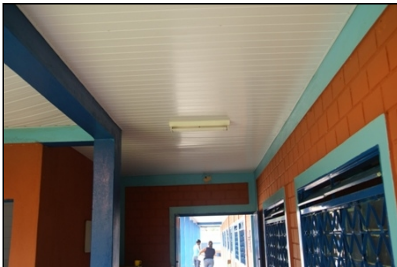
Vista do forro de PVC novo, no corredor.