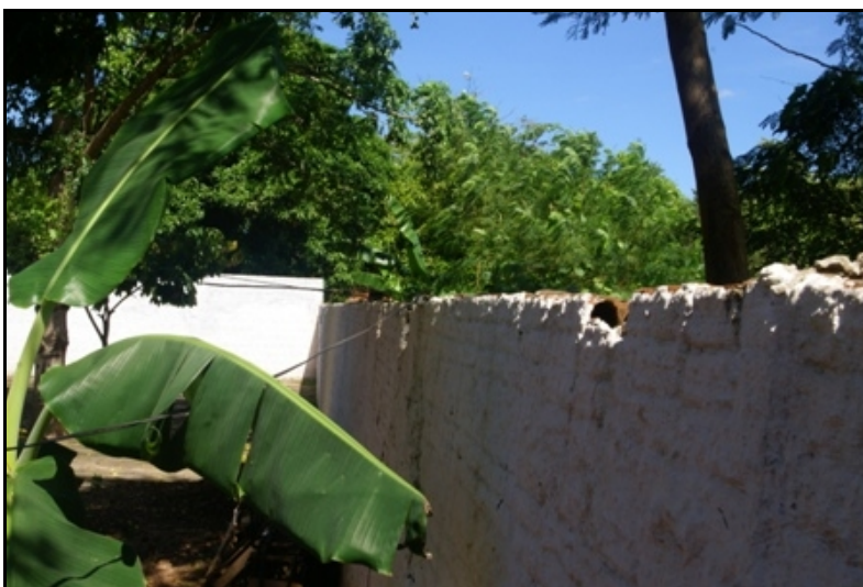
Muro dos fundos da creche, fora de prumo, evidenciando iminente tombamento.