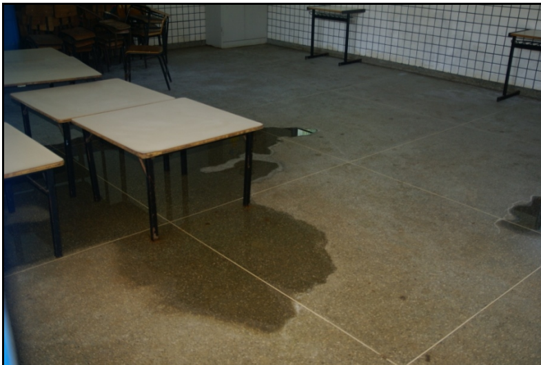
Água no piso em decorrência de goteira