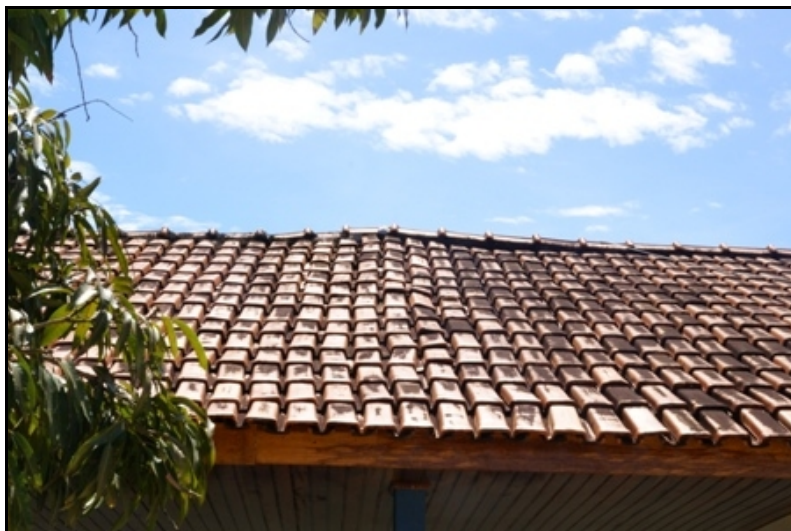
Telhado deformado com goteira