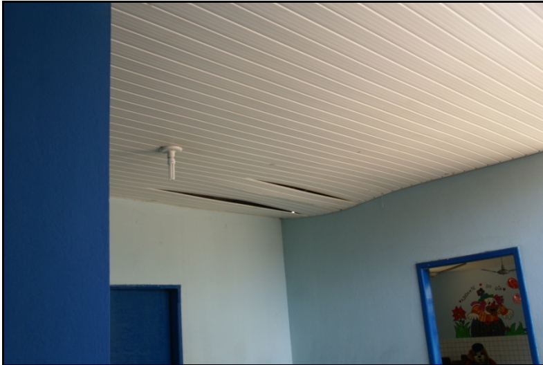
Fôrro de PVC não reparado