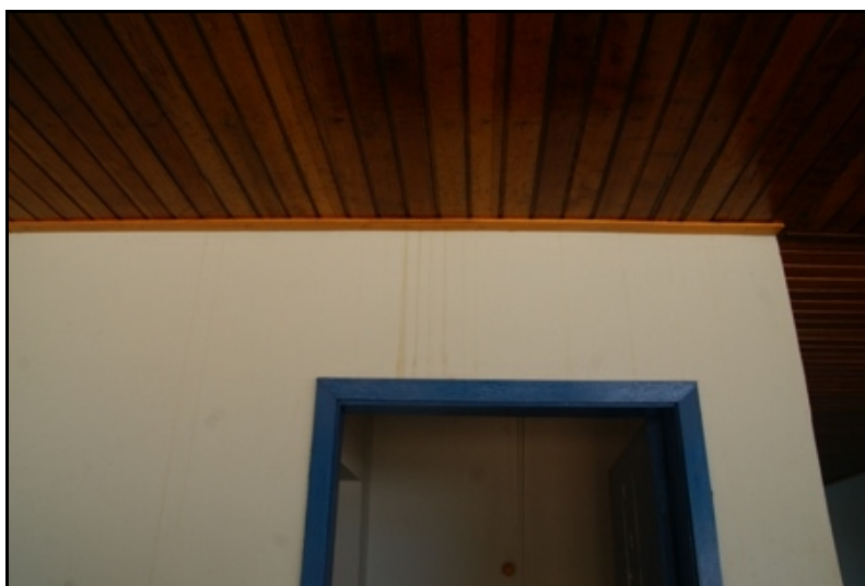
Sinal de goteira na parede