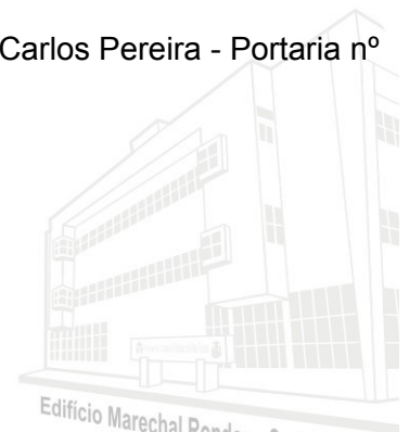
Edifício Marechal Rondon - Sede atual 2013