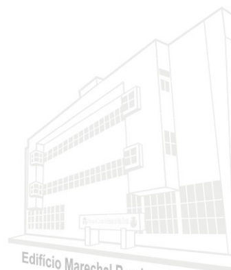
Edifício Marechal Rondon - Sede atual 2013