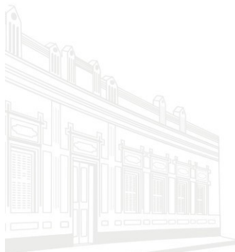
Casa Barão de Melgaço - 1ª Sede 1953