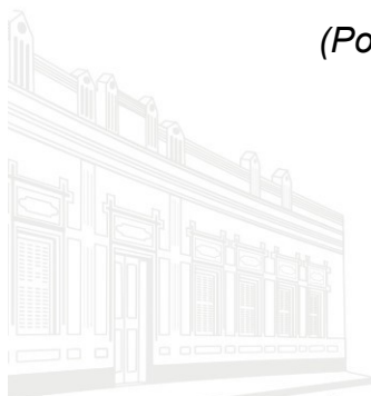
Casa Barão de Melgaço - 1ª Sede 1953

(Portaria nº 158/2015, DOC 764, de 09/12/2015)