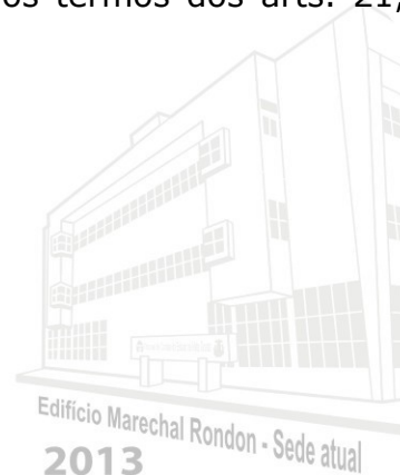
Edifício Marechal Rondon - Sede atual 2013

Y:\2018\SANÇÕES X\nOTIFICAÇÃO\229180-2017.odt