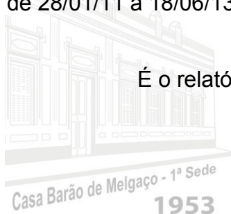
Casa Barão de Melgaço - 1ª Sede 1953