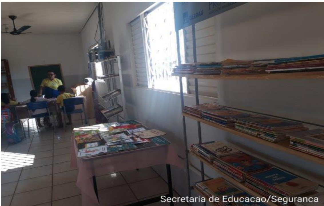
Secretaria de Educacao/Seguranca