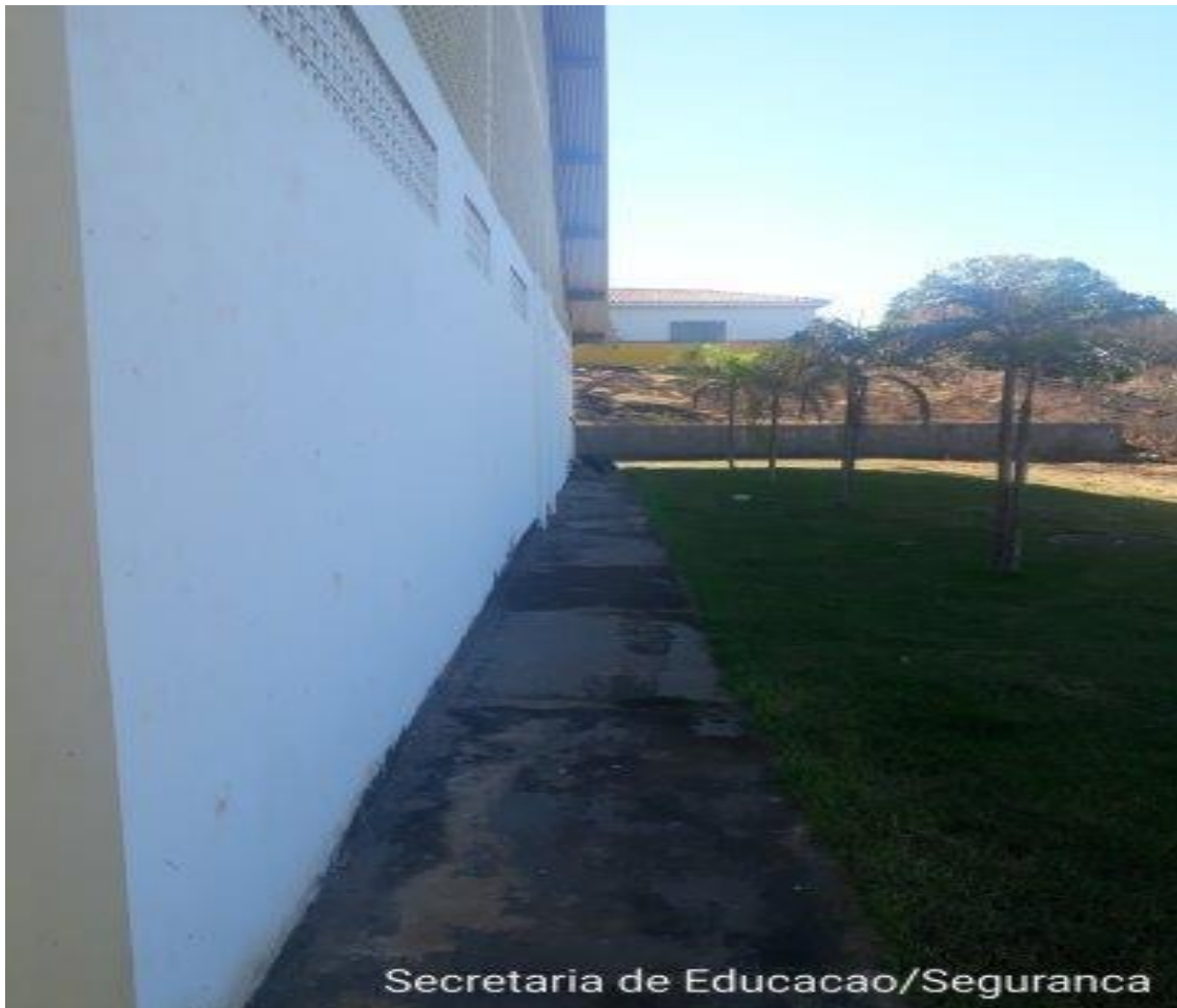
Parede externa da escola