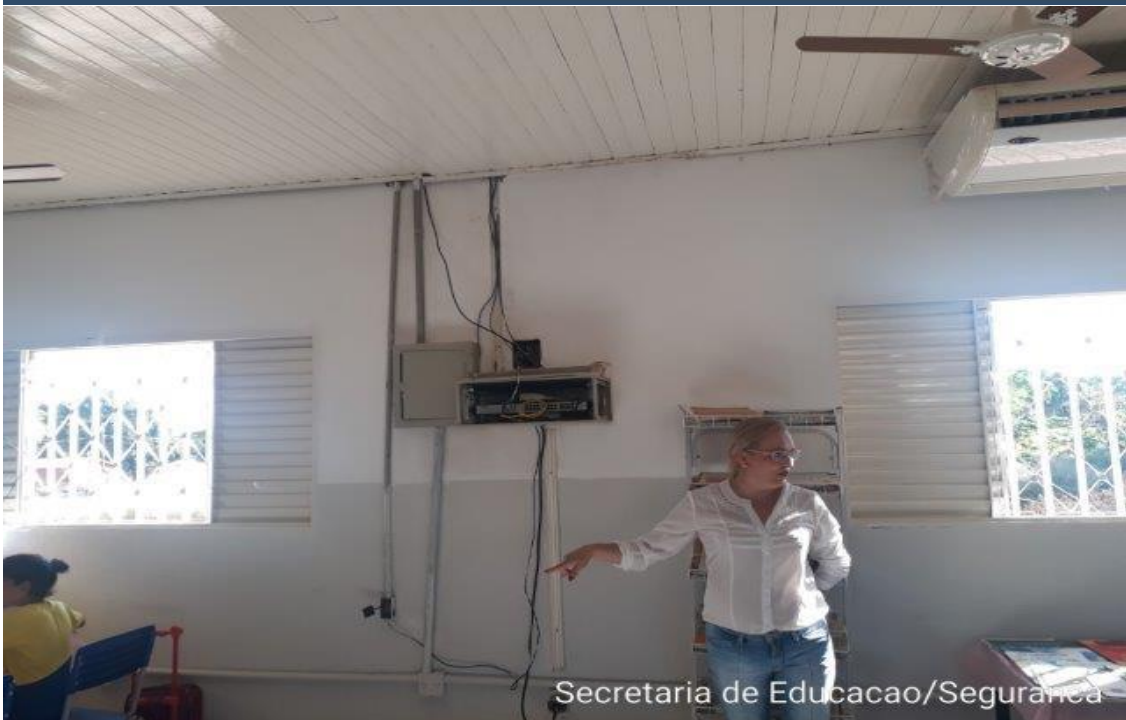
Secretaria de Educacao/Seguranca