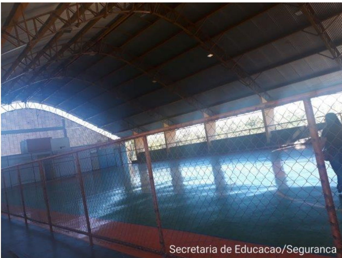
Secretaria de Educacao/Seguranca