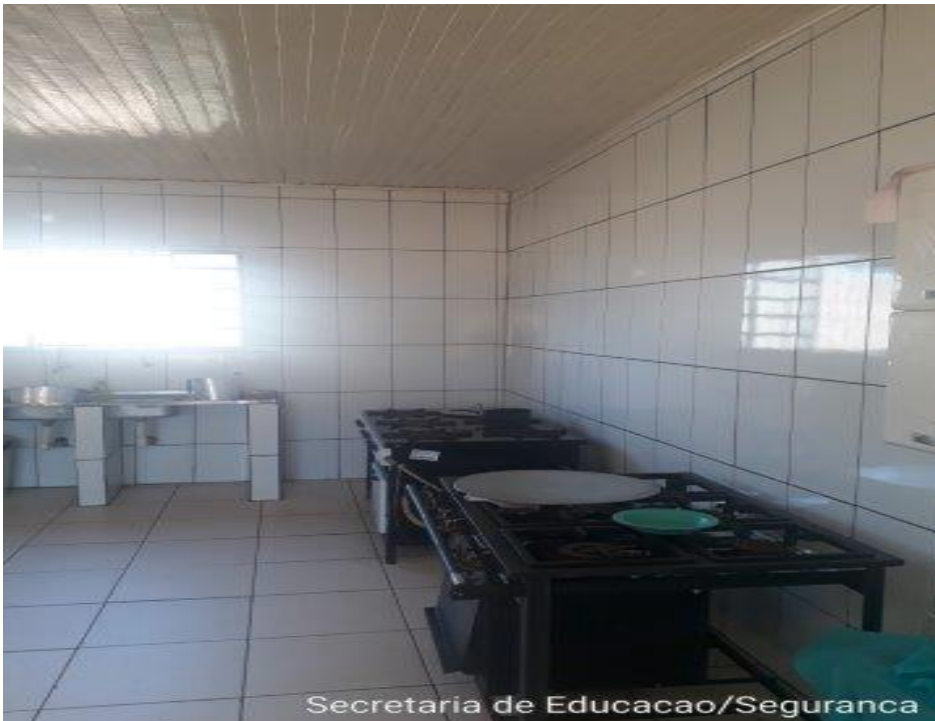
Secretaria de Educacao/Seguranca