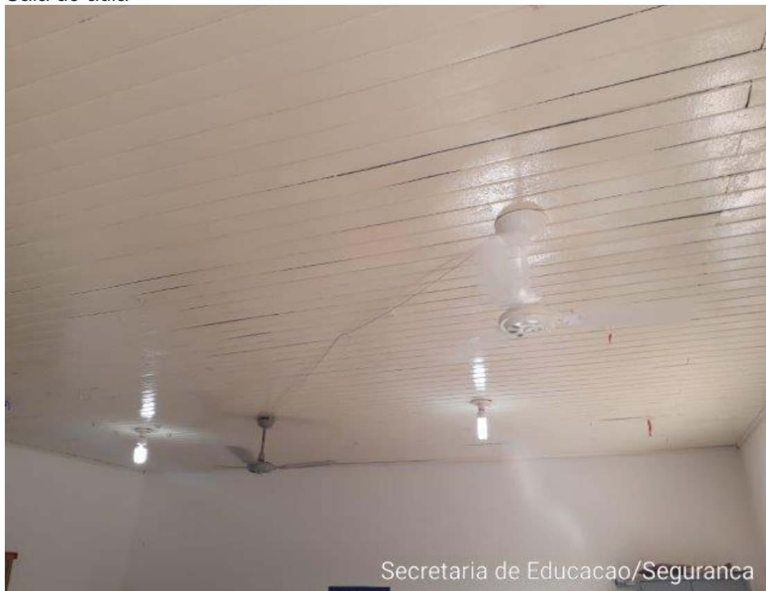
Sala de aula