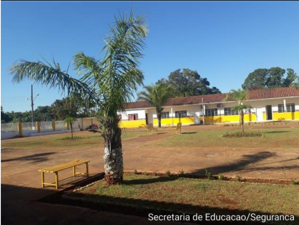
Secretaria de Educacao/Seguranca