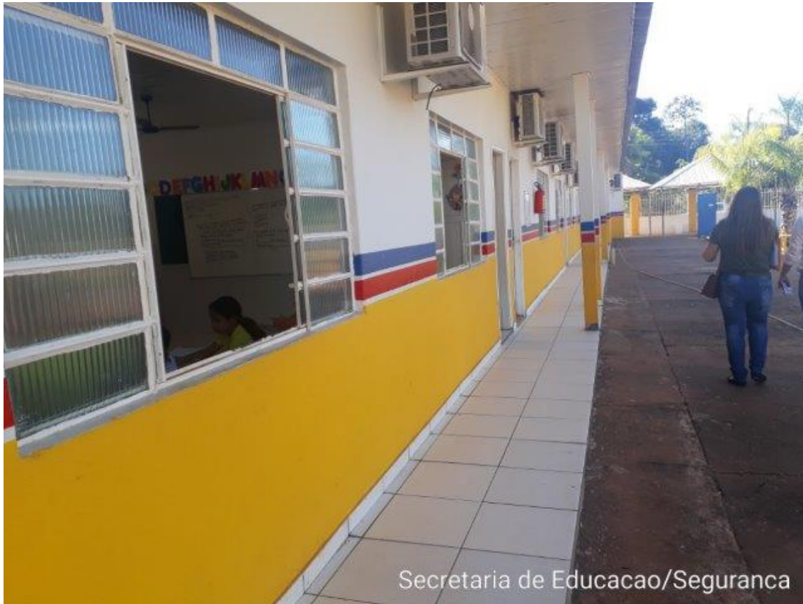
Secretaria de Educacao/Seguranca