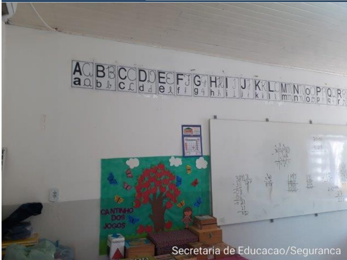
Secretaria de Educacao/Seguranca