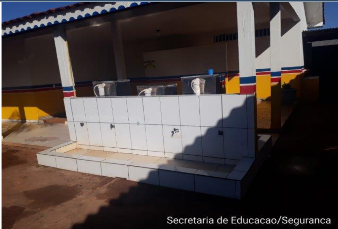
Secretaria de Educacao/Seguranca