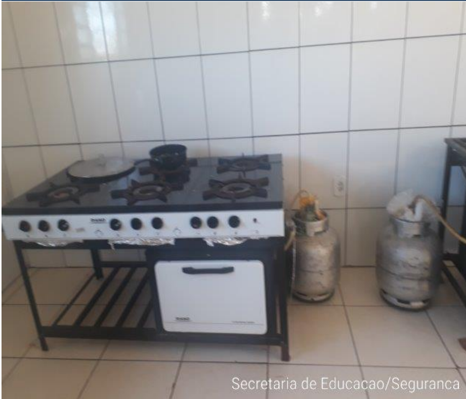
Secretaria de Educacao/Seguranca