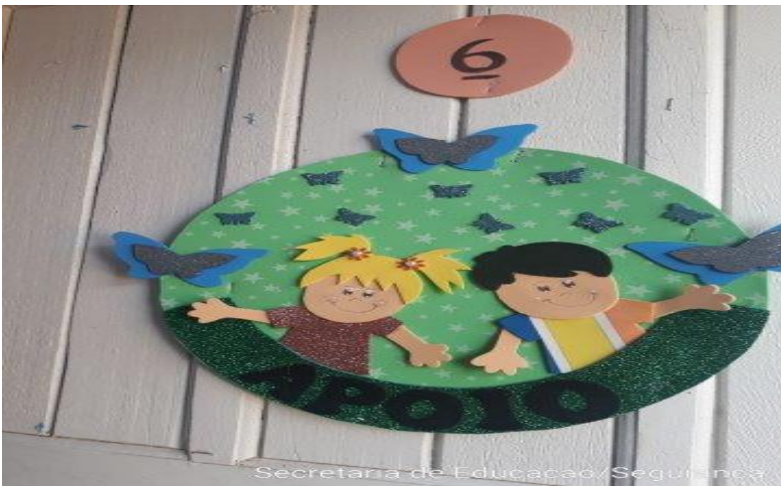
Secretaria de Educação/Segurança