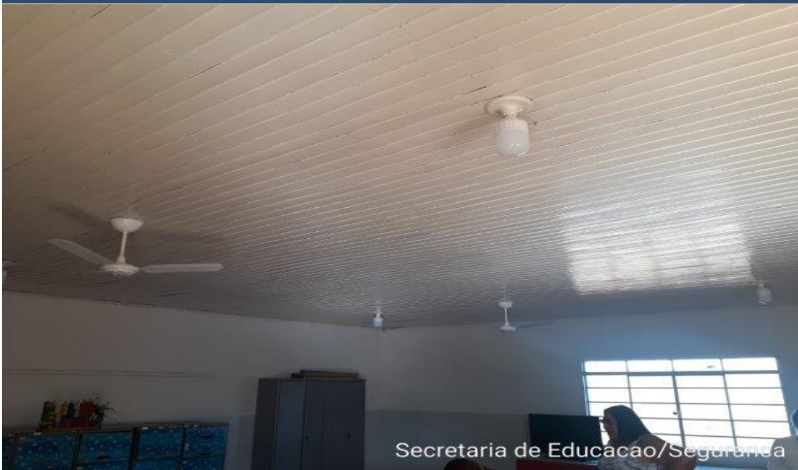
Secretaria de Educação/Segurança