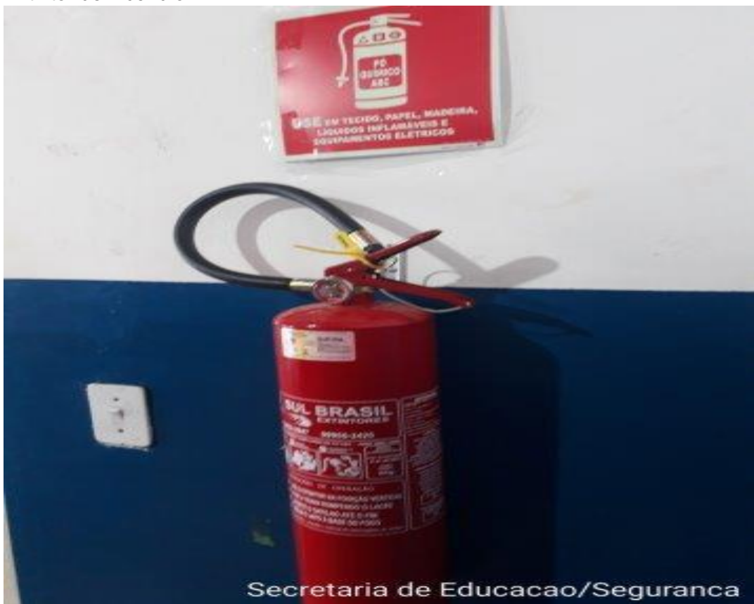
Extintor de incêndio