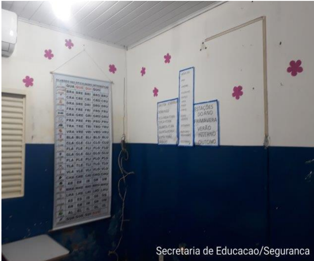
Secretaria de Educacao/Seguranca