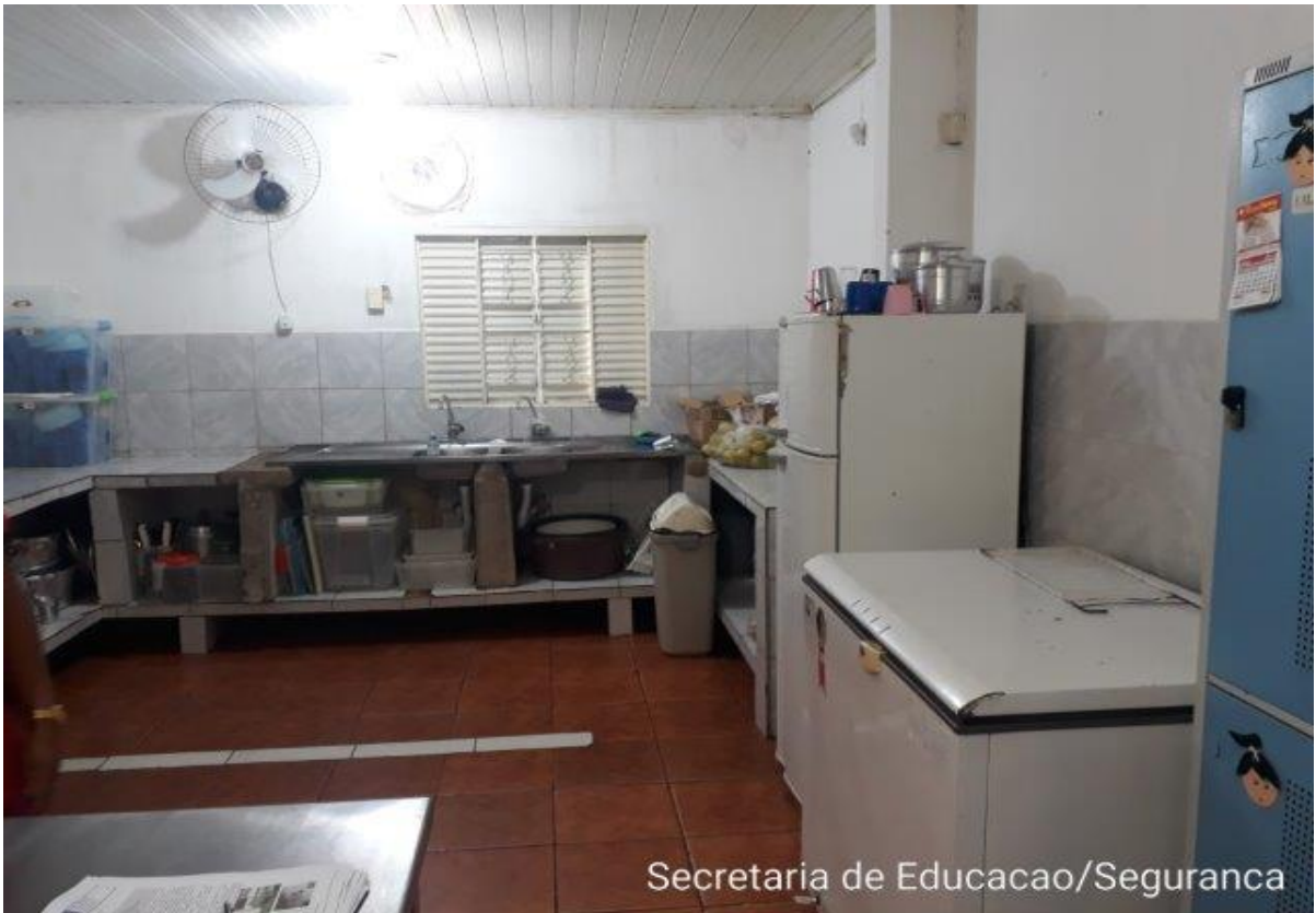
Secretaria de Educacao/Seguranca