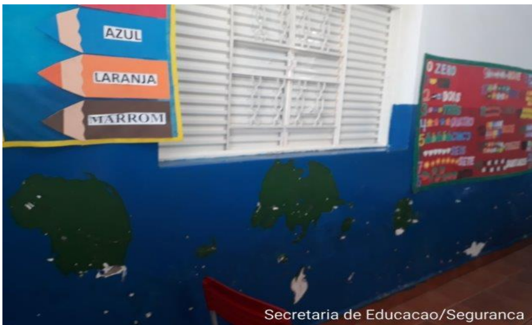
Secretaria de Educacao/Seguranca