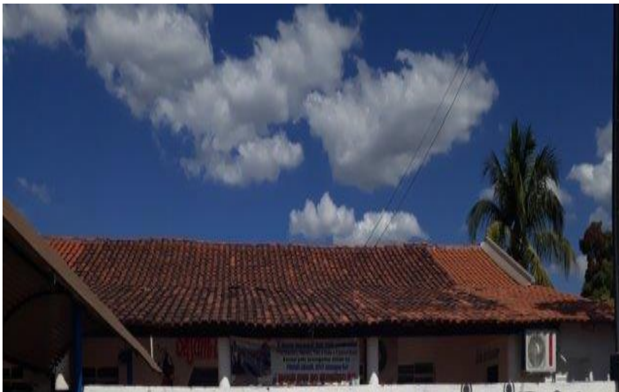
Telhado da Escola