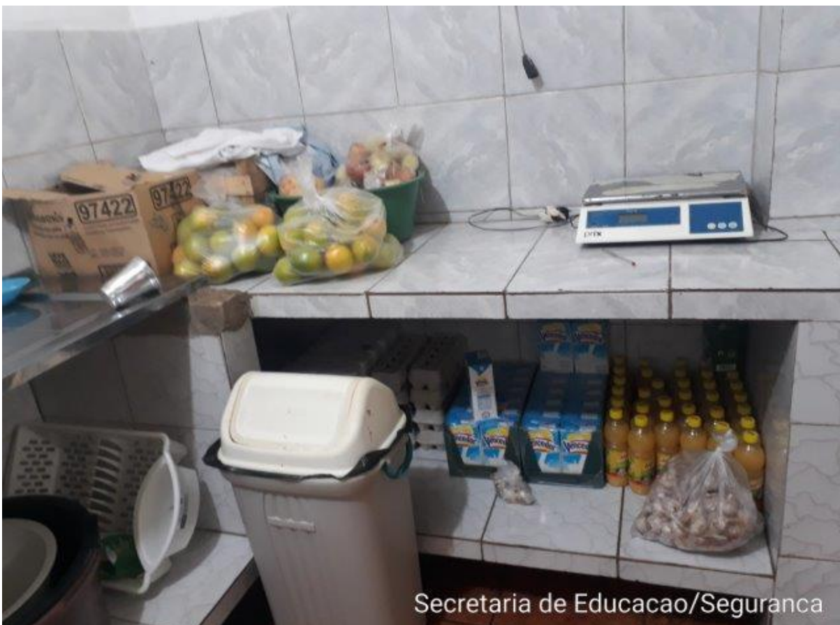
Secretaria de Educacao/Seguranca