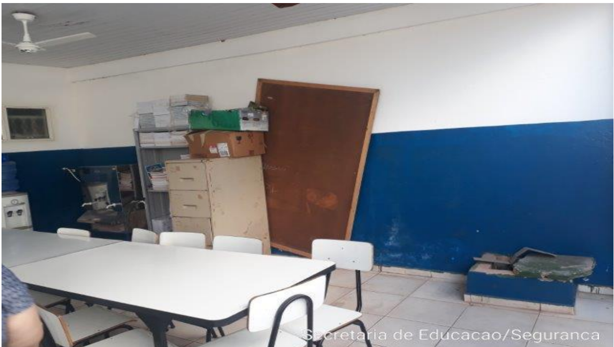
Secretaria de Educacao/Seguranca