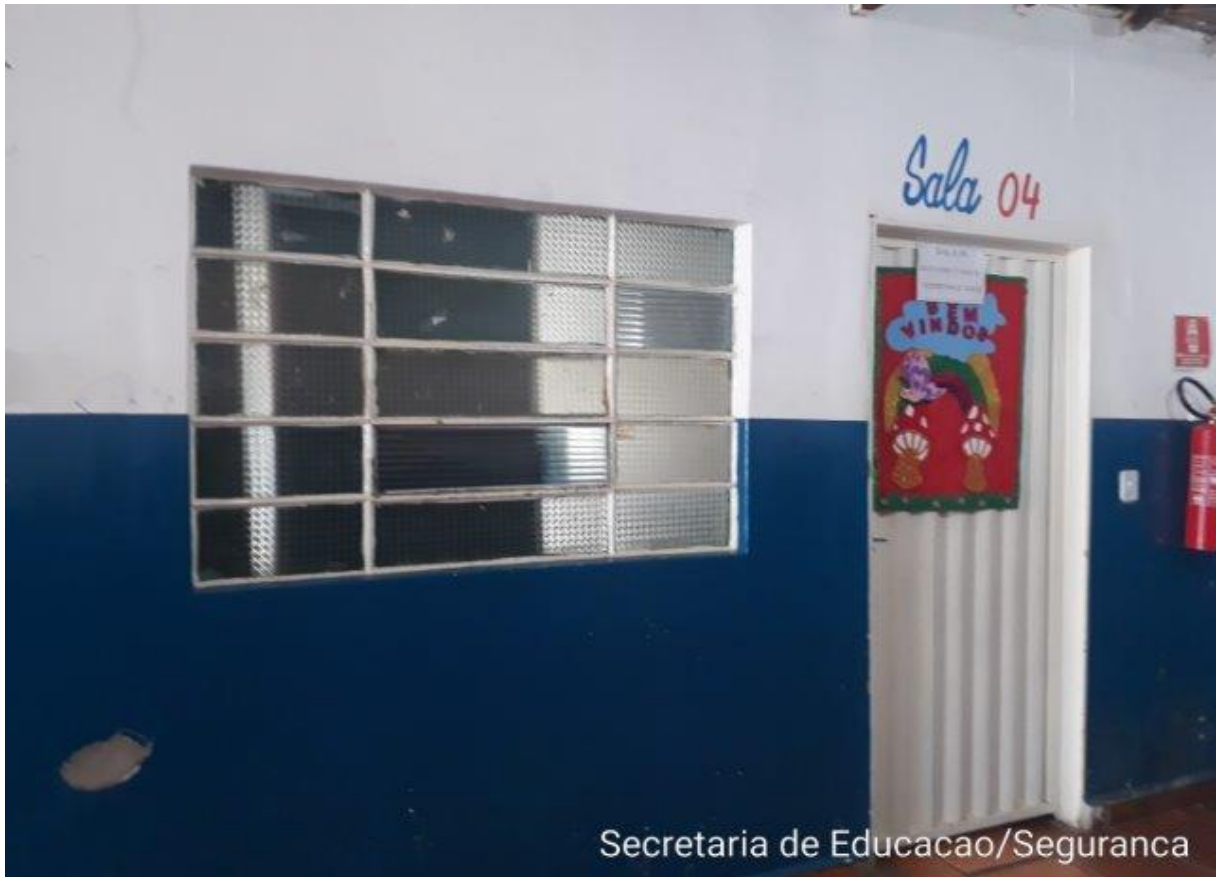
Secretaria de Educacao/Seguranca