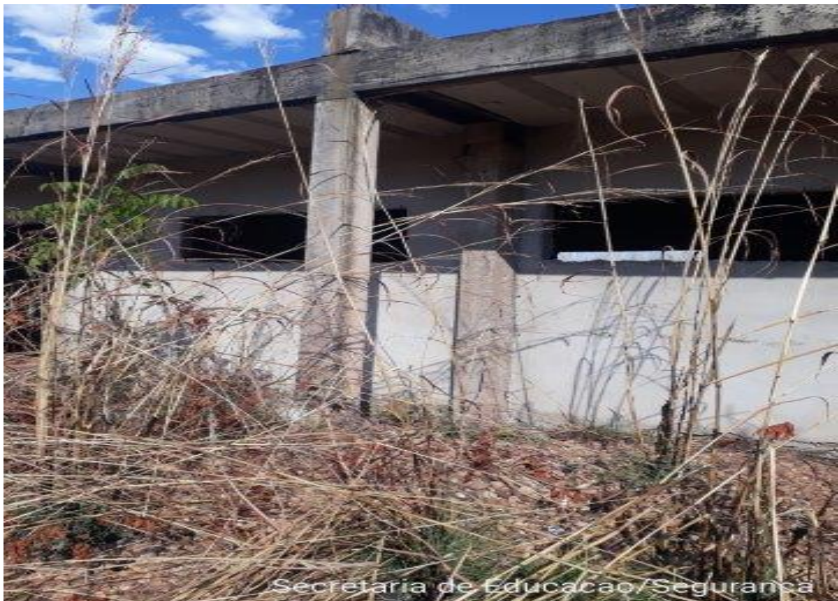
Secretaria de Educacao/Seguranca