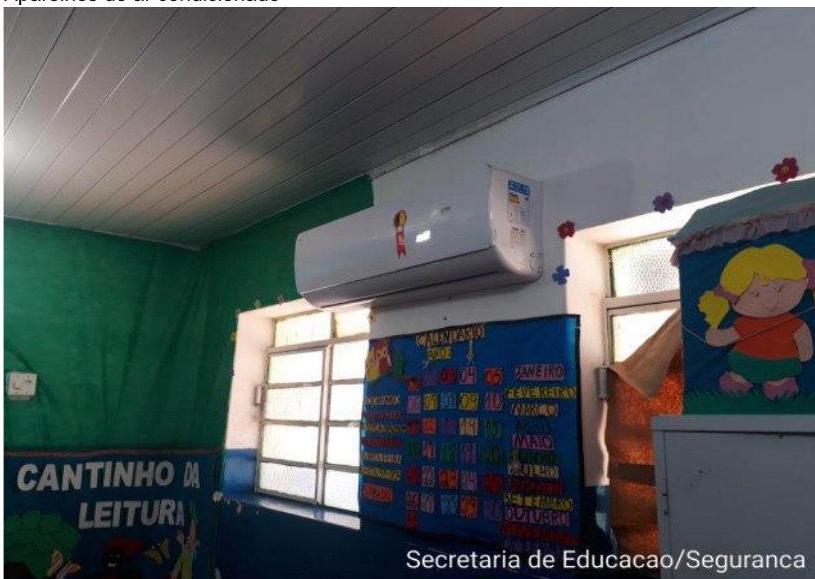
Aparelhos de ar condicionado