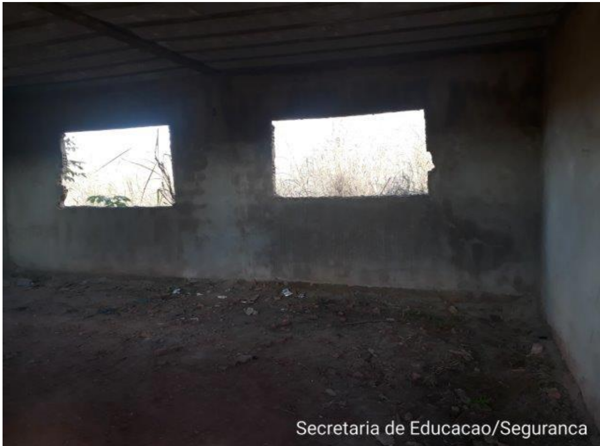
Secretaria de Educacao/Seguranca