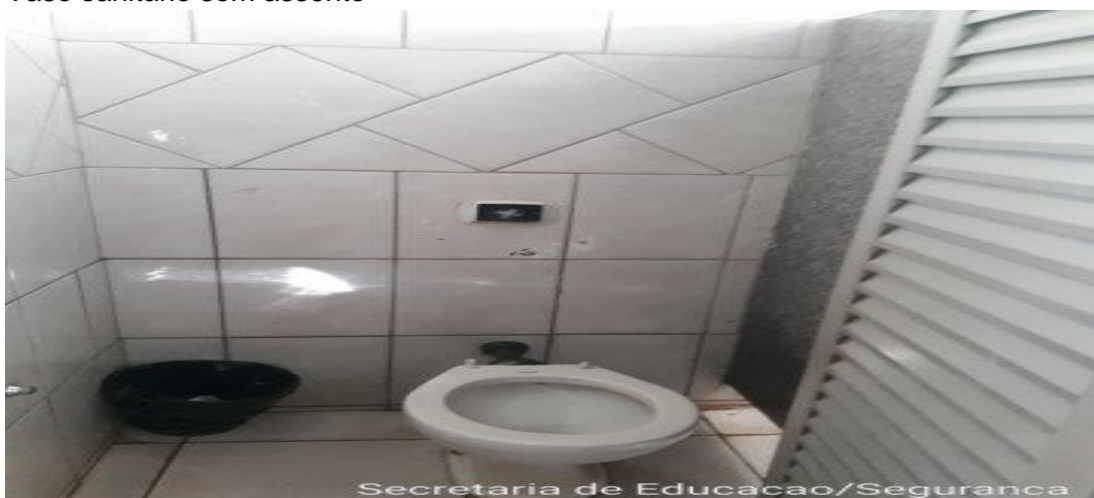
Vaso sanitário sem assento