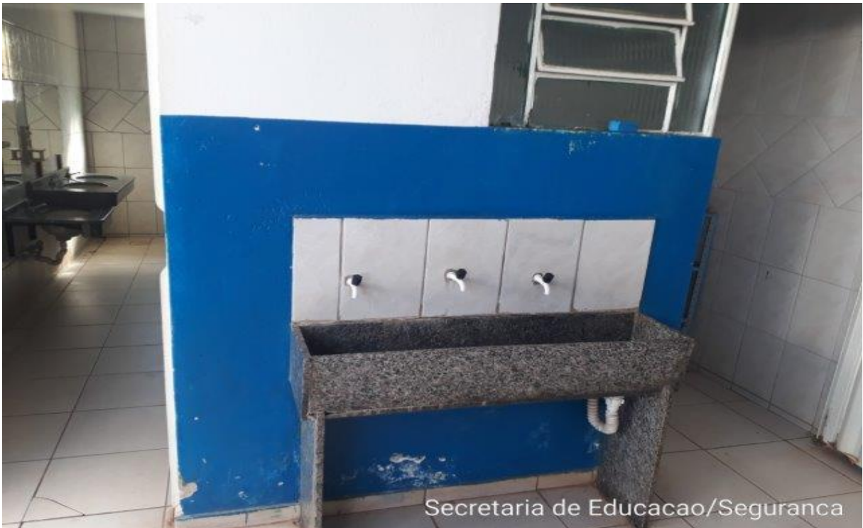
Secretaria de Educacao/Seguranca