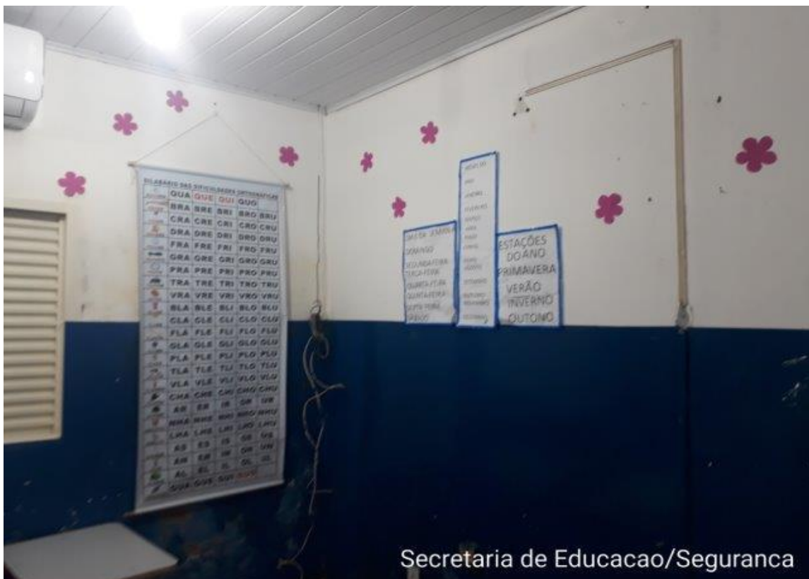
Secretaria de Educacao/Seguranca