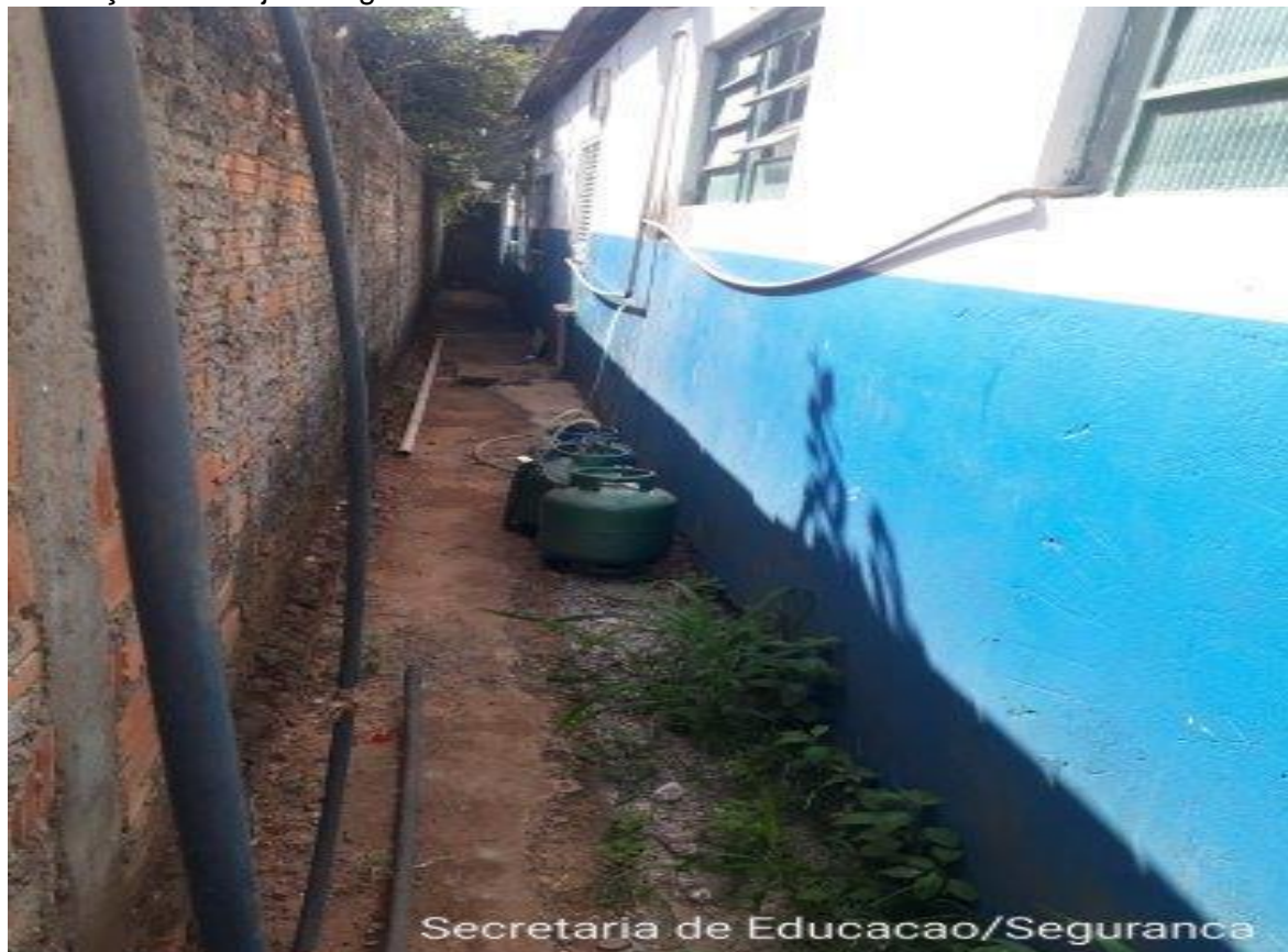
Instalação de botijão de gás de cozinha na área externa