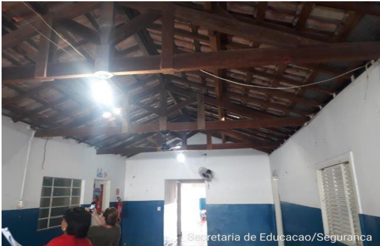
Secretaria de Educacao/Seguranca