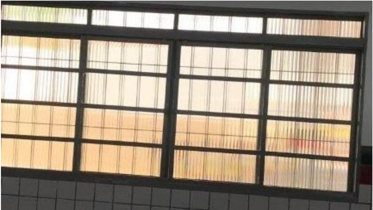
Vidraça da sala 1 colocada