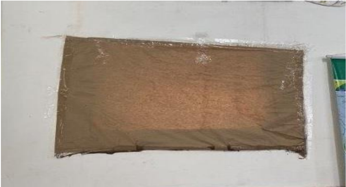
Pintura nova (parede externa aos banheiros)