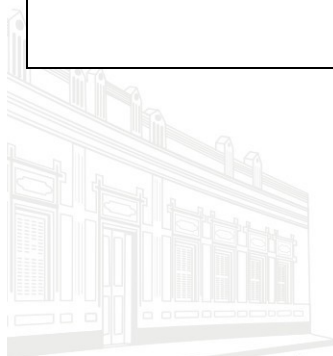
Casa Barão de Melgaço - 1ª Sede 1953