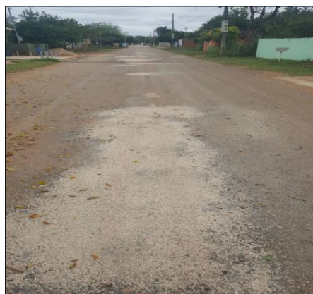
Fonte: Fotos da 2ª medição do serviço de tapa-buraco