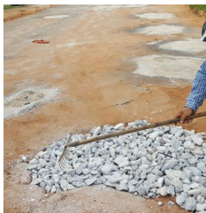
Fonte: Fotos da 1ª medição do serviço de tapa-buraco