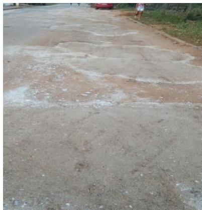
Fonte: Fotos da 1ª medição do serviço de tapa-buraco