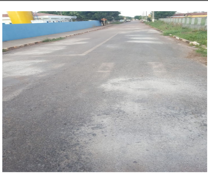
Rua Tiradentes (Trecho Creche Proinfancia)