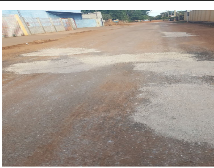
Rua Tenente Silvio Martins