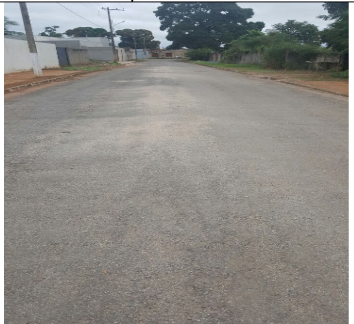
Rua Cel. Teófilo