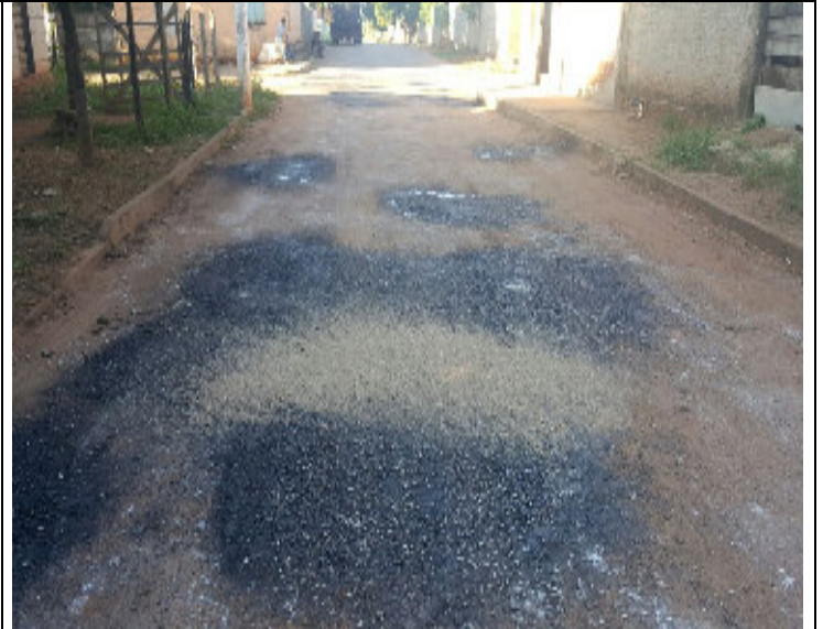
Rua Marechal Rondon