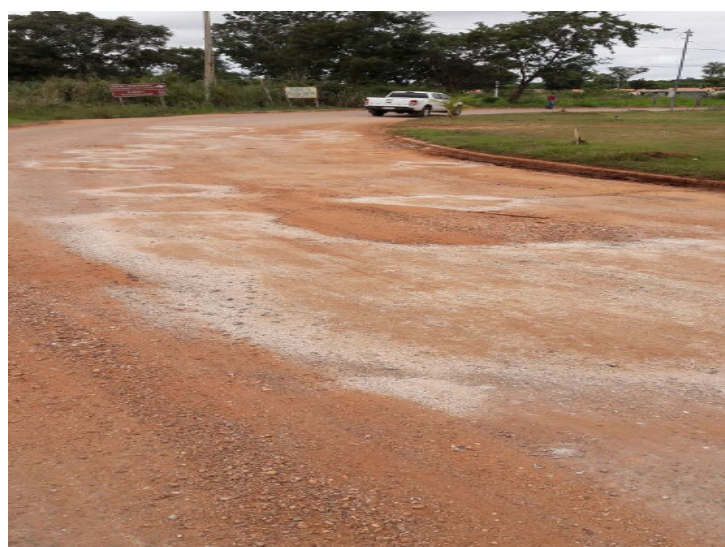
Avenida Anibal de Toledo