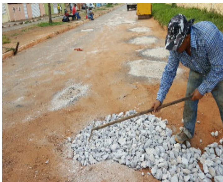
Rua Joaquim Murтинho