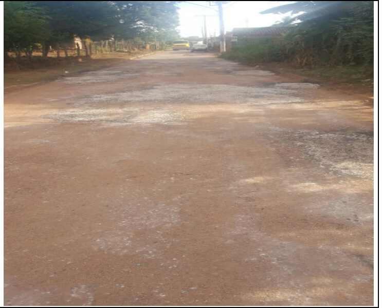
Rua Frei Carlos Vallet