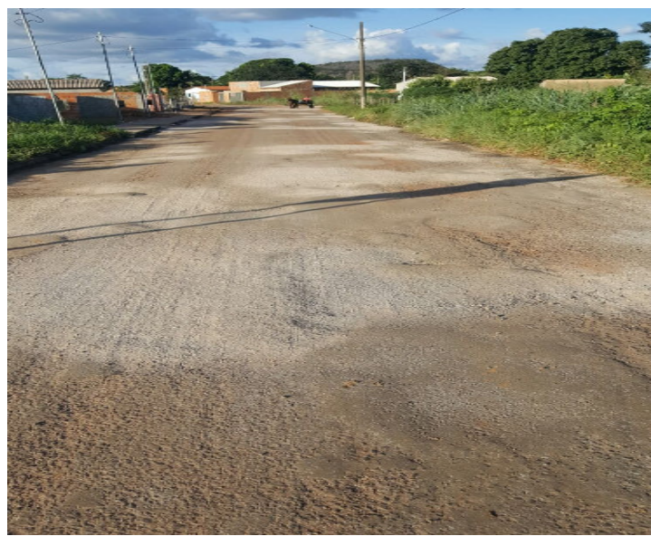
Rua Justino Francisco