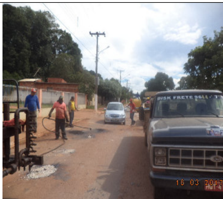
Rua Joaquim Murтинho (Trecho da Igreja)