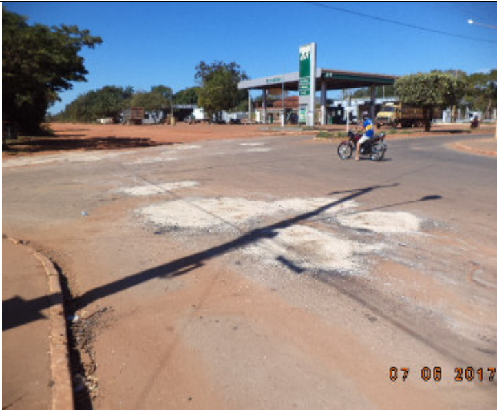
Rua Generoso Ponce/Av.Dom Aquino