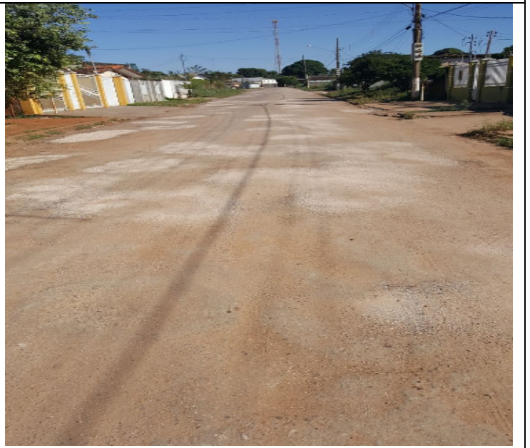
Travessa 21 de Abril