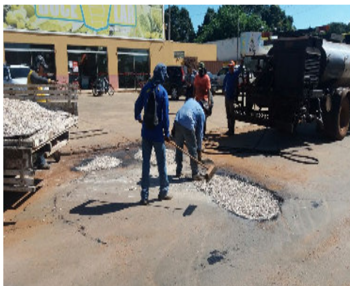
Rua Joaquim Murтинho (Trecho Rua ABC)