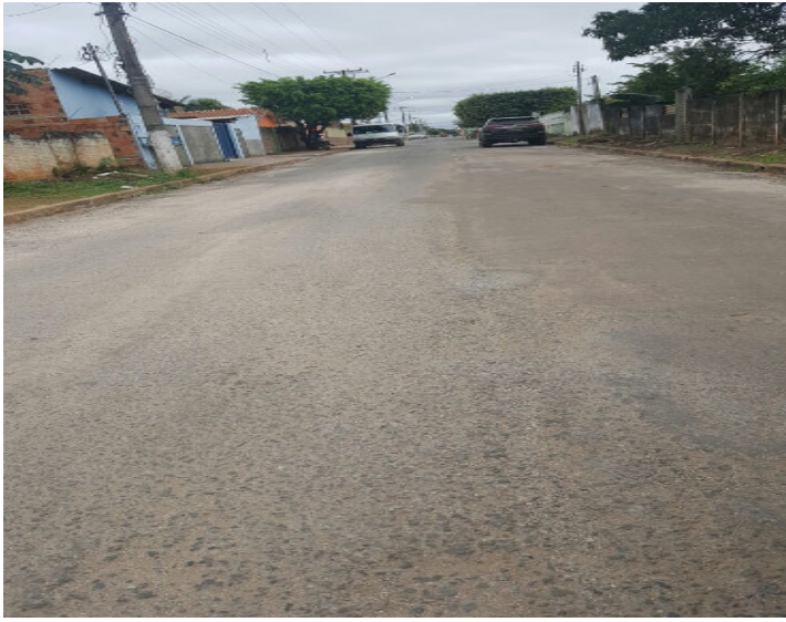
Rua Presidente Marques