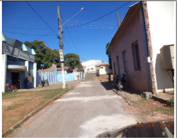
Rua XV de Novembro