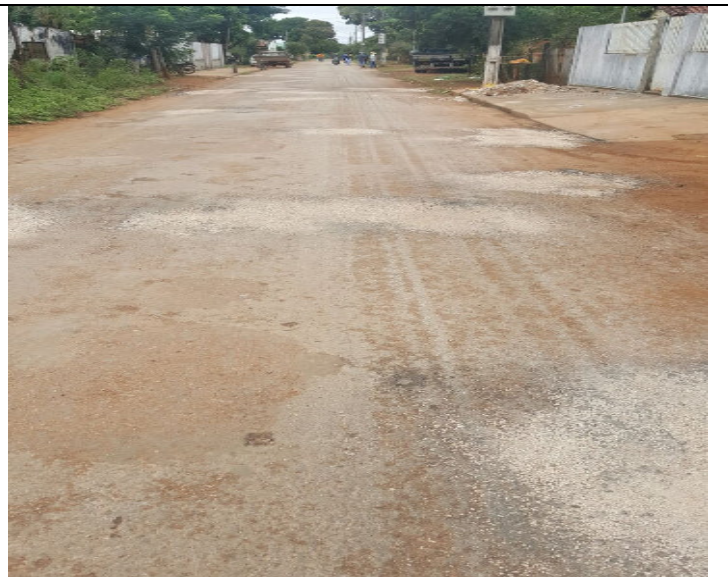
Rua Desembragador Martins