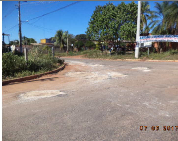
Rua Generoso Ponce/Rod. Porto Cercado