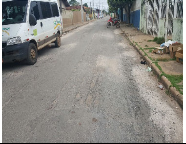
Rua Presidente Marques