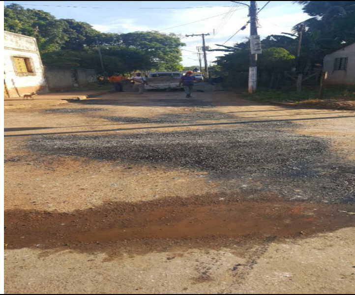
Rua Frei Carlos Vallet