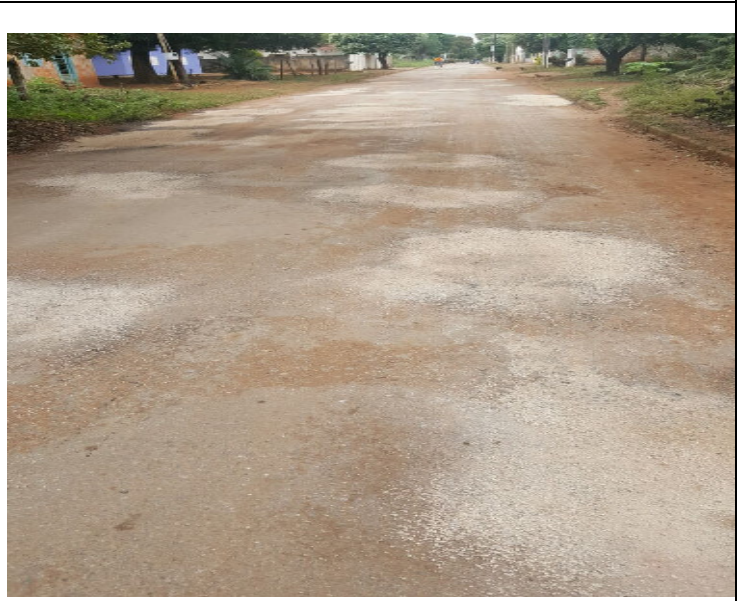
Rua Madre Luiza