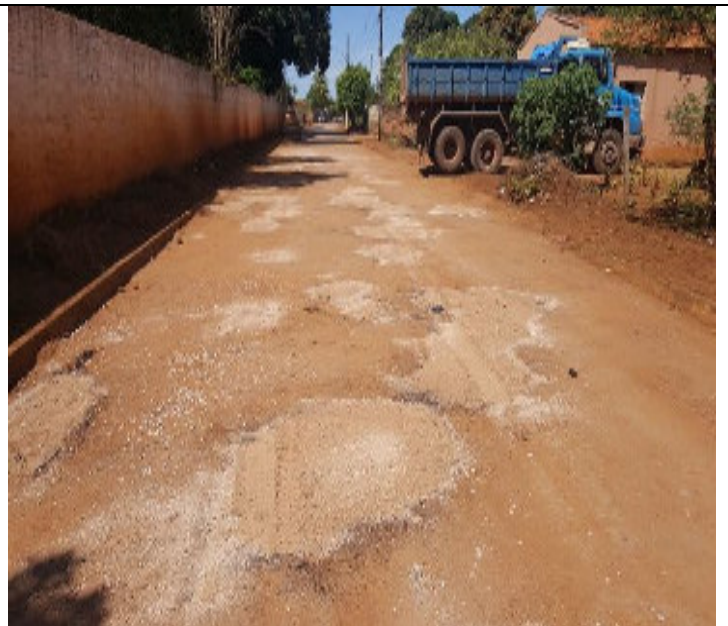
Rua Justino Francisco