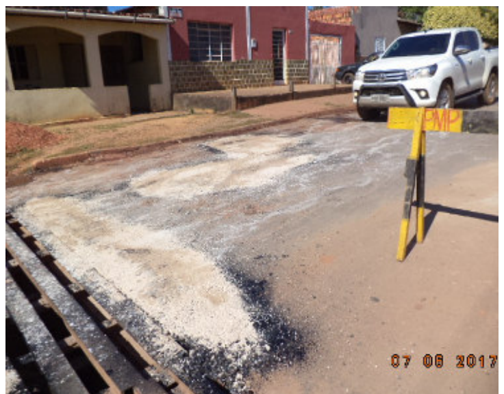
Rua Generoso Ponce