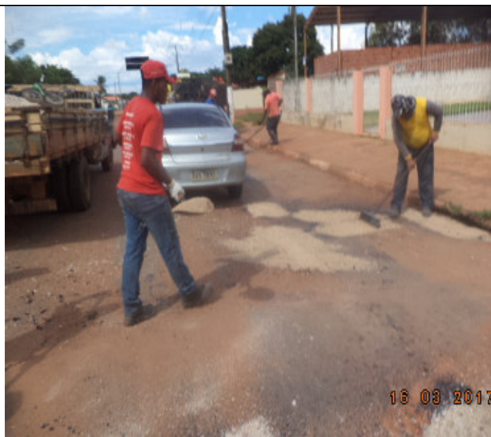
Rua Joaquim Murтинho