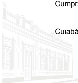
Casa Barão de Melgaço - 1ª Sede 1953