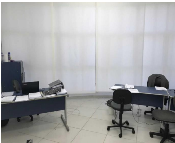
Figura 2 – Sala do Diretor Executivo do CONSPREV e do Contador cedido pelo Município de Jauru