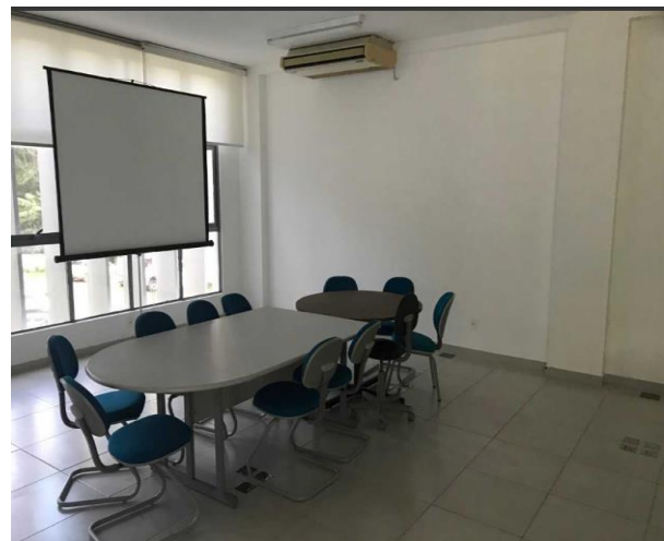
Figura 3 – Sala de reunião cedida pela AMM ao CONSPREV