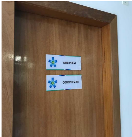
Figura 1 – Porta de entrada do CONSPREV