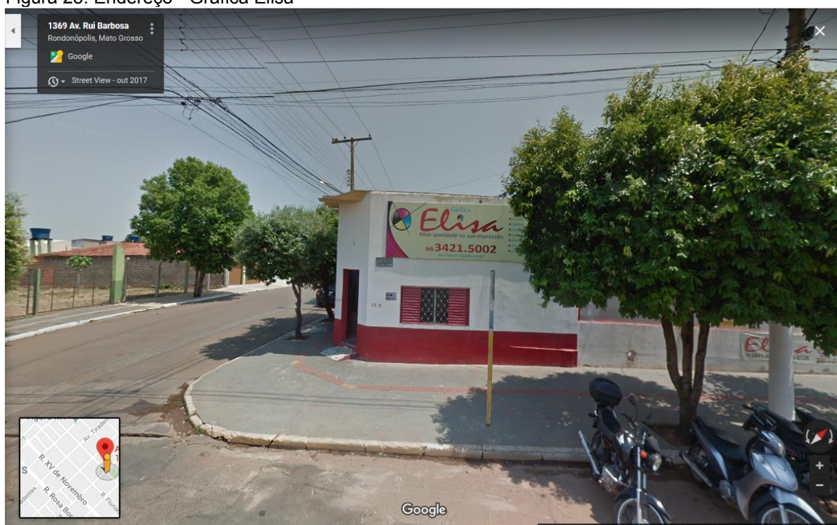
Figura 28: Endereço - Gráfica Elisa