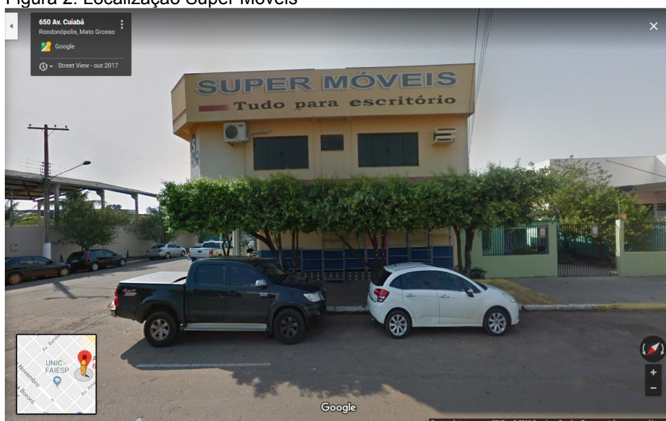
Figura 2: Localização Super Móveis

Fonte: Street View Out-2017. Data de acesso: 29/01/2019