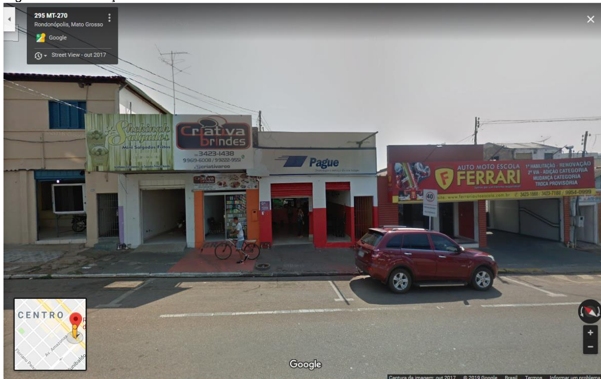
Figura 32: Endereço Criativa Comércio