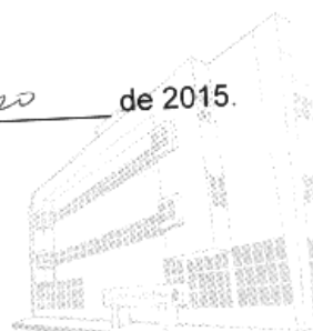
Edifício Marechal Rondon - Sede atual 2013