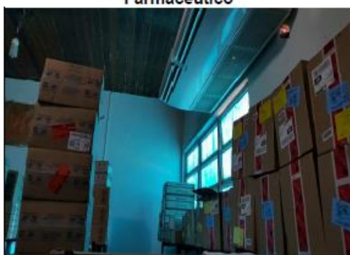
Foto 15 - Centro de Abastecimento Farmacêutico

Fonte: inspeções físicas realizadas. Centro de Abastecimento Farmacêutico