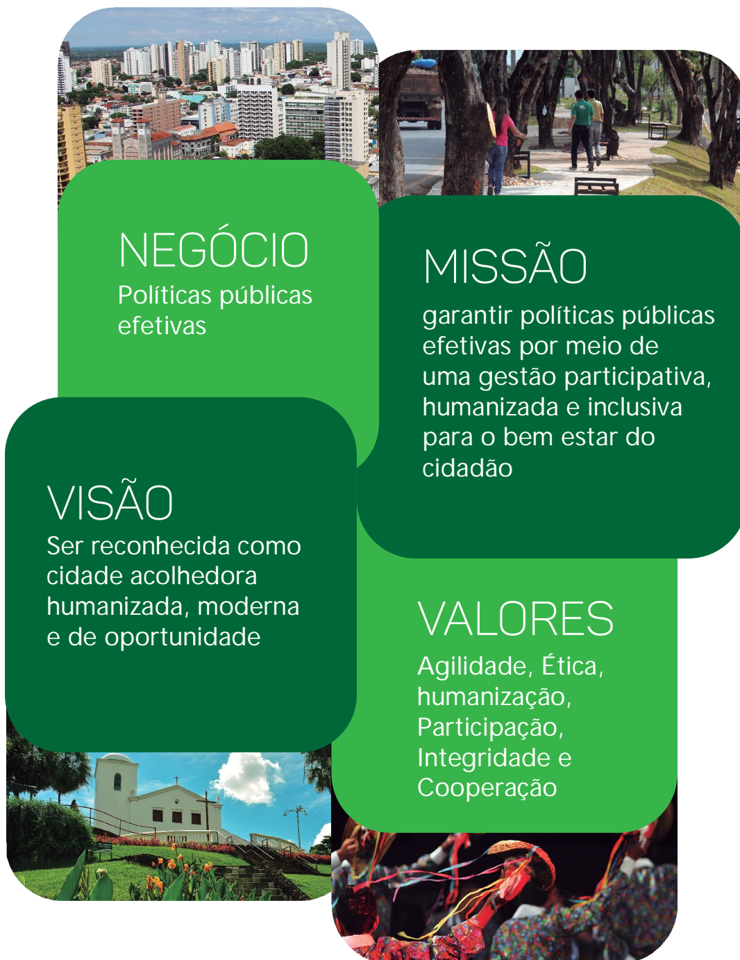
Figura 2: Identidade Organizacional