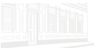
Casa Barão de Melgaço - 1ª Sede 1953

TOTAL DE GLOSA PENDENTE: R$ 0,00 // IPCA: R$ 0,00