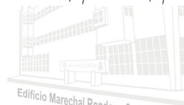
Edifício Marechal Rondon - Sede atual 2013