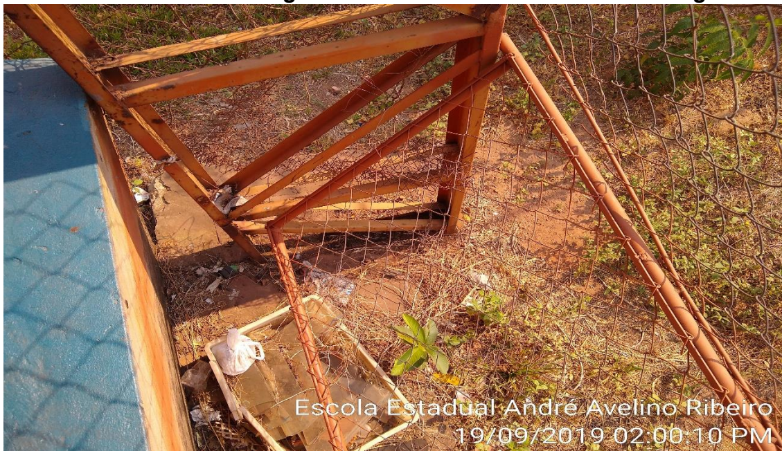
Escola Estadual André Avelino Ribeiro 19/09/2019 02:00:10 PM