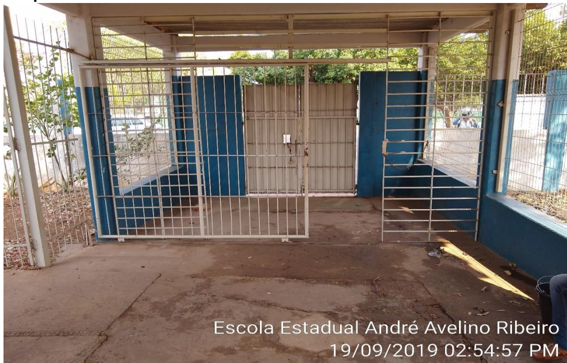
Escola Estadual André Avelino Ribeiro 19/09/2019 02:54:57 PM

Portão da entrada com o suporte no chão para o portão correr, mas não atrapalha o cadeirante.