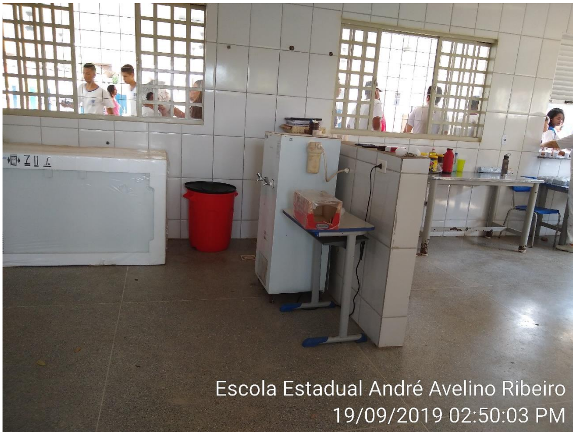
Escola Estadual André Avelino Ribeiro 19/09/2019 02:50:03 PM