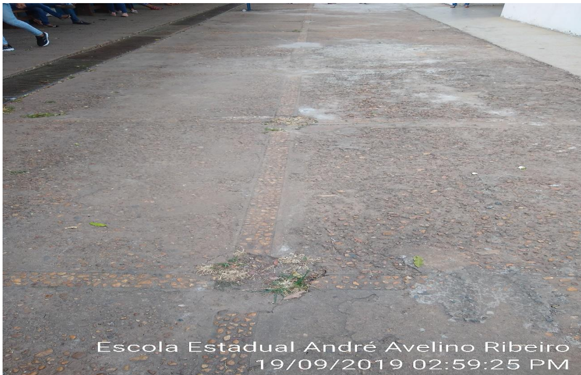
Escola Estadual André Avelino Ribeiro 19/09/2019 02:59:25 PM