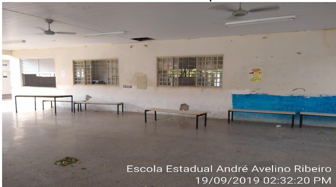
Escola Estadual André Avelino Ribeiro 19/09/2019 02:32:20 PM

permanece a construção sem conclusão. Portanto, não foi entregue a obra para a escola que está sob a responsabilidade da SEDUC. No refeitório há um canto em que eles acomodam o material referente a merenda, mas ainda não foi entregue a despensa; assim como o refeitório e a cozinha. Como já foi dito, foram liberados parcialmente a cozinha e o refeitório. Reafirmando que a cozinha não está concluída, não é elaborada a merenda, apenas biscoitos, leite e sucos são servidos, a comida não é feita. Devido ao reduzido número de funcionários: 03 fornecem a merenda, sendo 01 de apoio e dois para servir a merenda para 600 alunos em cada turno: vespertino e matutino, formando uma fila enorme de alunos. A merenda é servida de uma forma precária, onde frutas e biscoitos são disponibilizados diretamente nas mãos dos alunos.