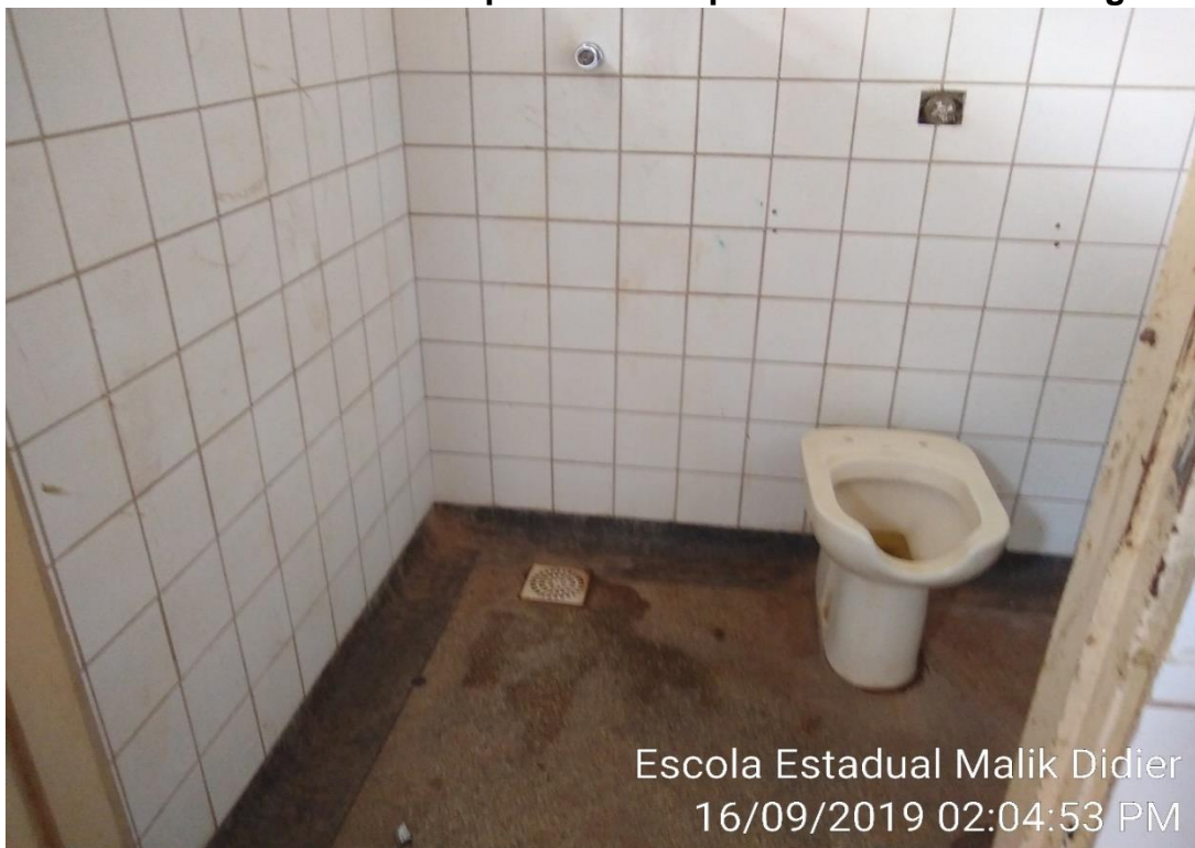
Escola Estadual Malik Didier 16/09/2019 02:04:53 PM

Banheiro com vaso sem tampa e sem tampa da válvula de descarga.