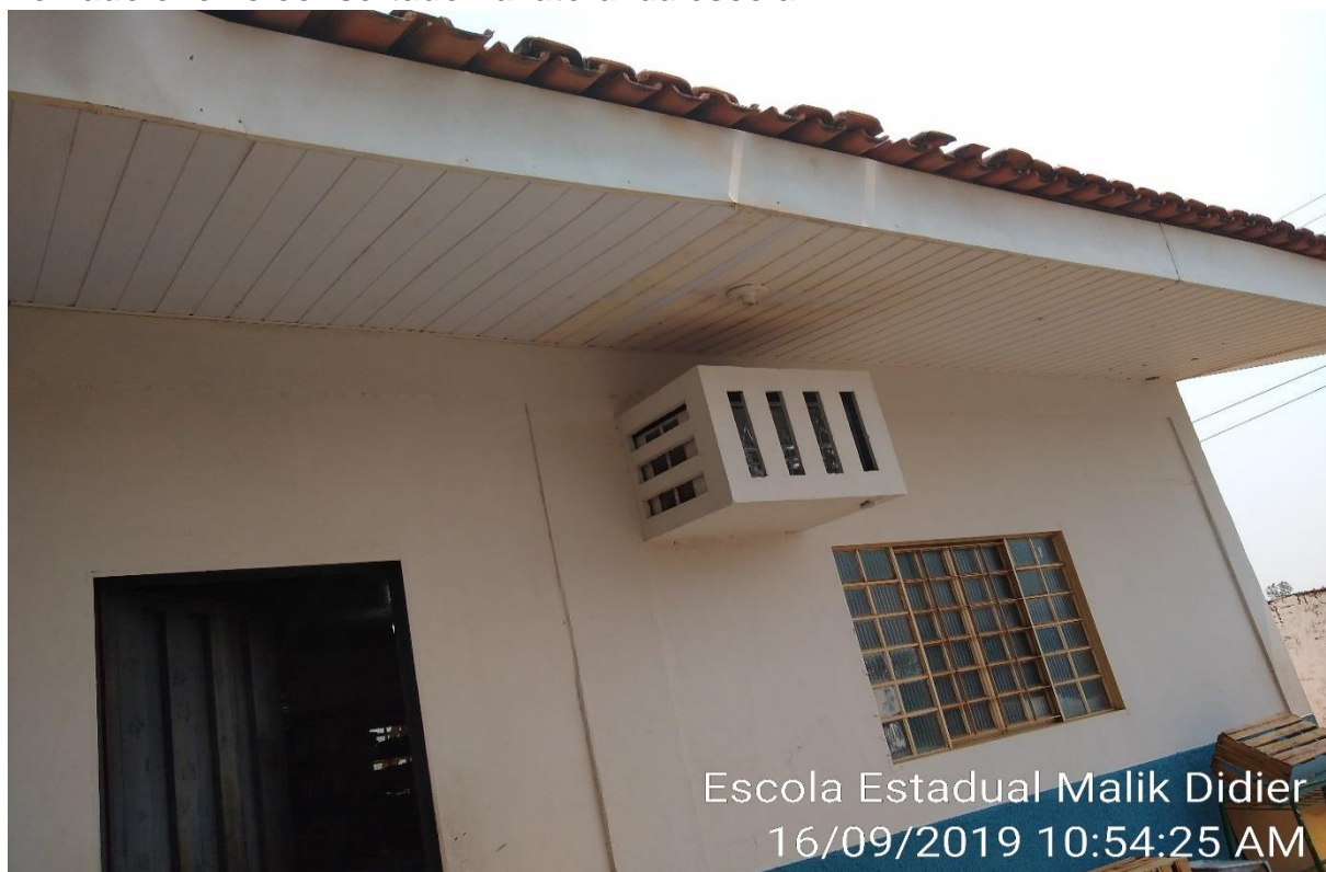
Escola Estadual Malik Didier 16/09/2019 10:54:25 AM

Telhado e forro consertado na lateral da escola.