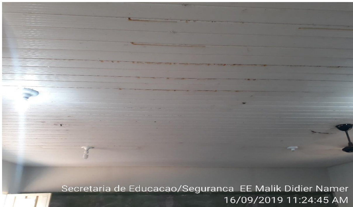
Secretaria de Educacao/Seguranca EE Malik Didier Namer 16/09/2019 11:24:45 AM