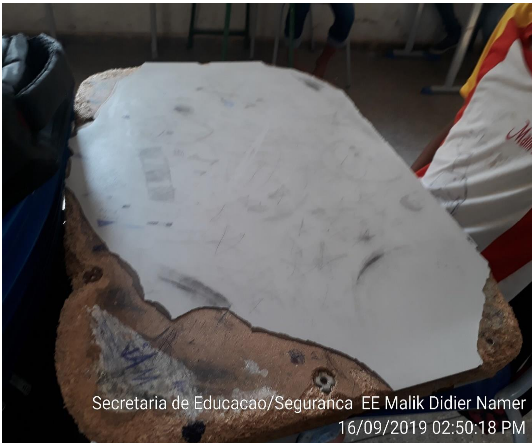
Secretaria de Educacao/Seguranca EE Malik Didier Namer 16/09/2019 02:50:18 PM