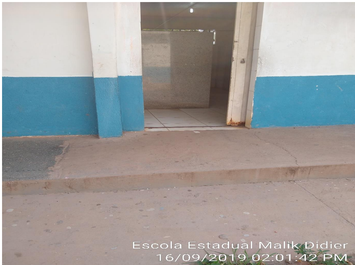
Escola Estadual Malik Didier 16/09/2019 02:01:42 PM