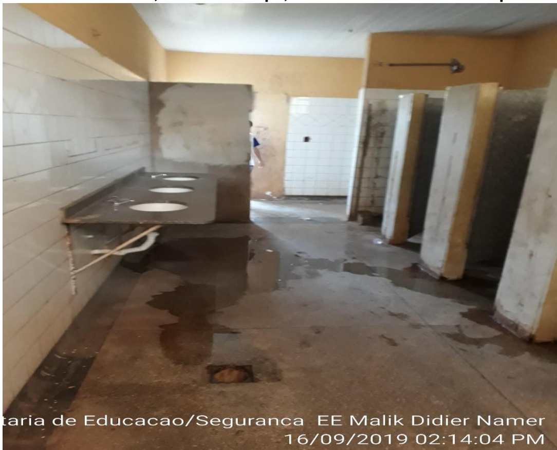
Secretaria de Educacao/Seguranca EE Malik Didier Namer 16/09/2019 02:14:04 PM

Torneiras ausentes, ralo sem tampa, boxes dos banheiros sem portas.