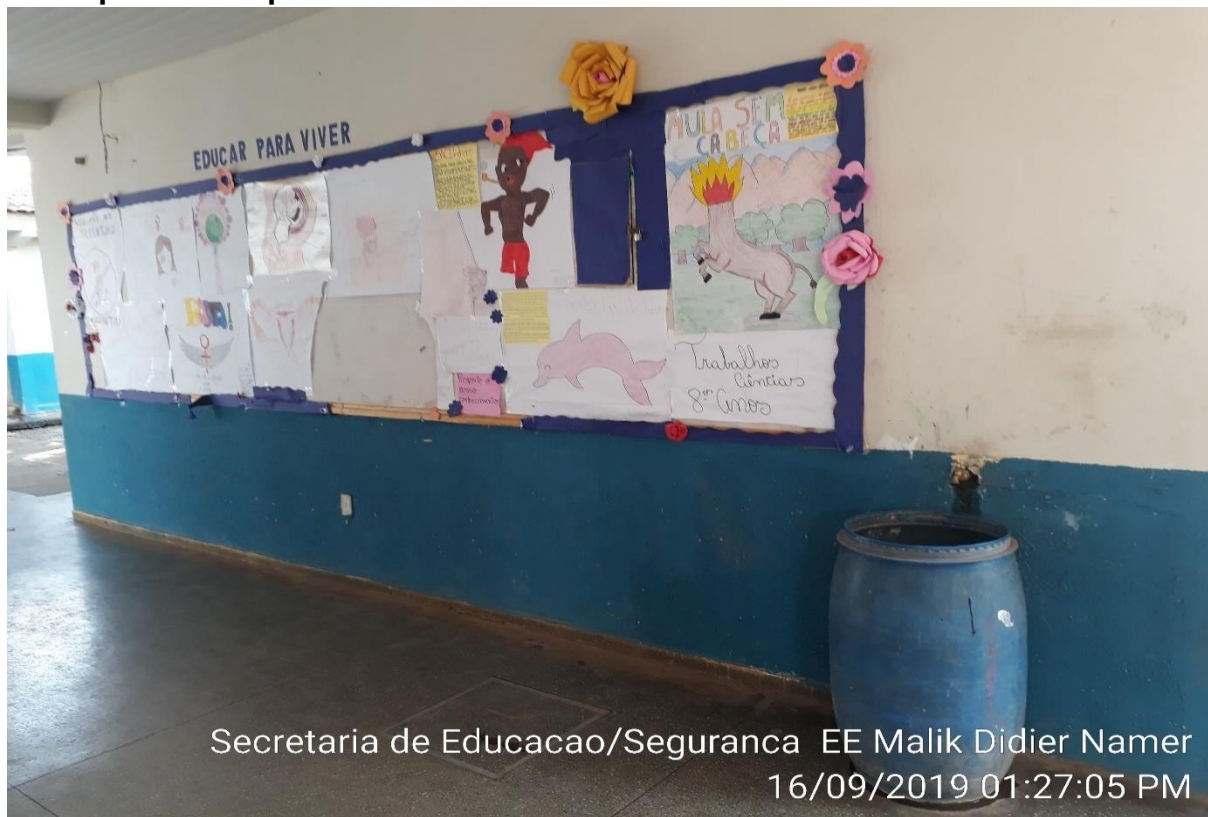
Secretaria de Educacao/Seguranca EE Malik Didier Namer 16/09/2019 01:27:05 PM

Cardápio não disponibilizado em local visível.