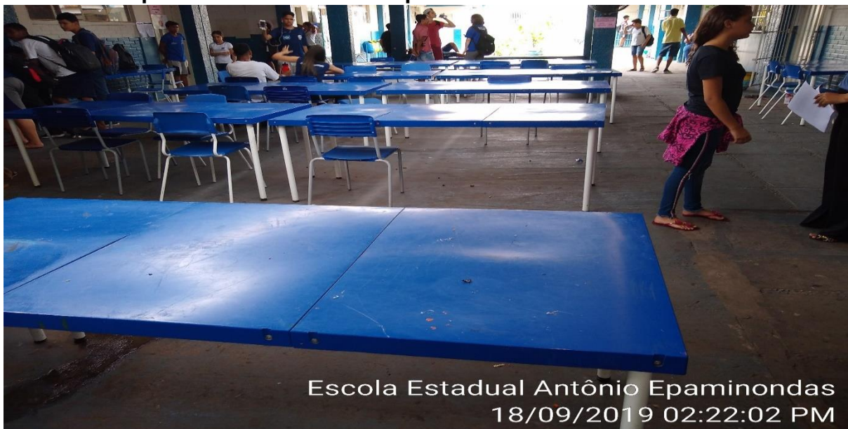
Escola Estadual Antônio Epaminondas 18/09/2019 02:22:02 PM