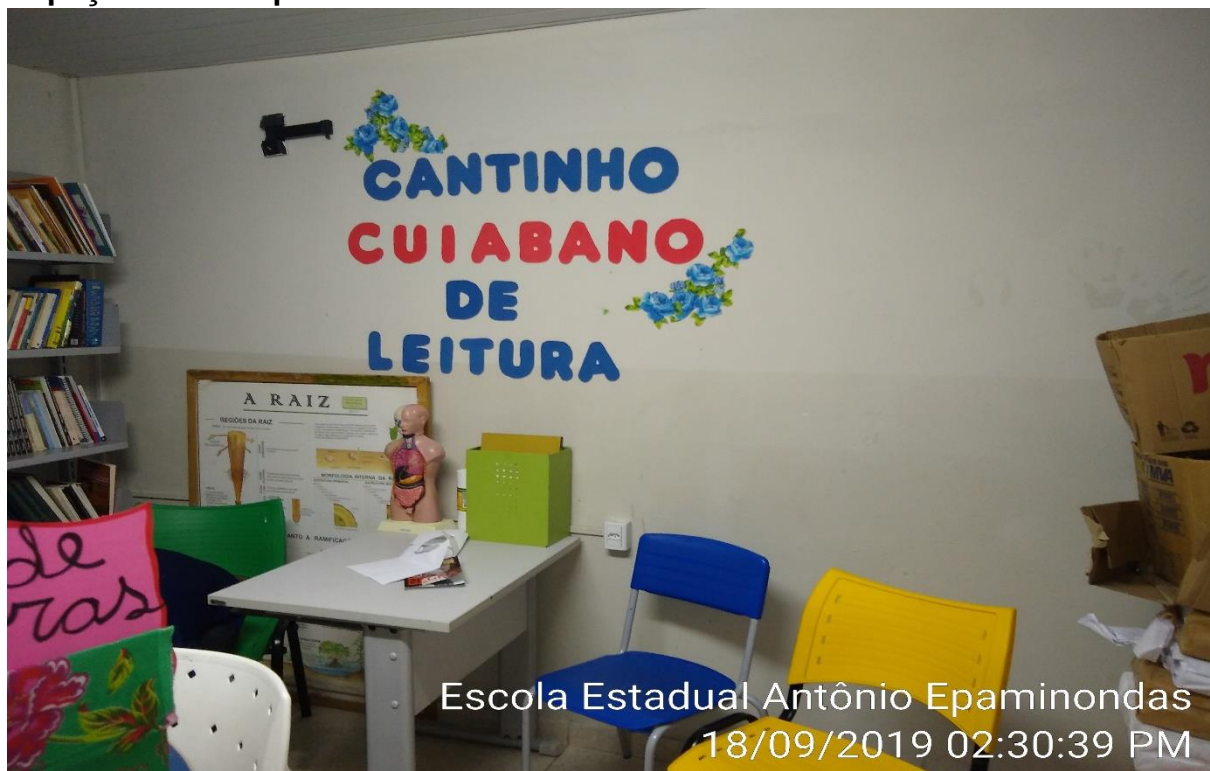
Escola Estadual Antônio Epaminondas 18/09/2019 02:30:39 PM