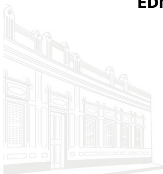
Casa Barão de Melgaço - 1ª Sede 1953