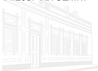
Casa Barão de Melgaço - 1ª Sede 1953

Advirto que o não atendimento desta diligência, implicará às penalidades previstas na Lei Orgânica deste Tribunal (art. 71 da LC 269/2007-TCE/MT) e Regimento Interno (Resolução 14/2007-RITCE/MT), sem prejuízo das demais sanções cabíveis, pois esta tem por finalidade a verificação da legalidade, da legitimidade, da eficiência e da economicidade dos atos e/ou contratos administrativos em geral, bem como o cumprimento das normas relativas à gestão fiscal, visando assegurar a eficácia do controle externo e instruir o julgamento de contas ao encargo do Tribunal, nos moldes do art. 35, da Lei Complementar 269/2007-TCE/MT e §1º do art. 36, Resolução 14/2007-RITCE/MT.