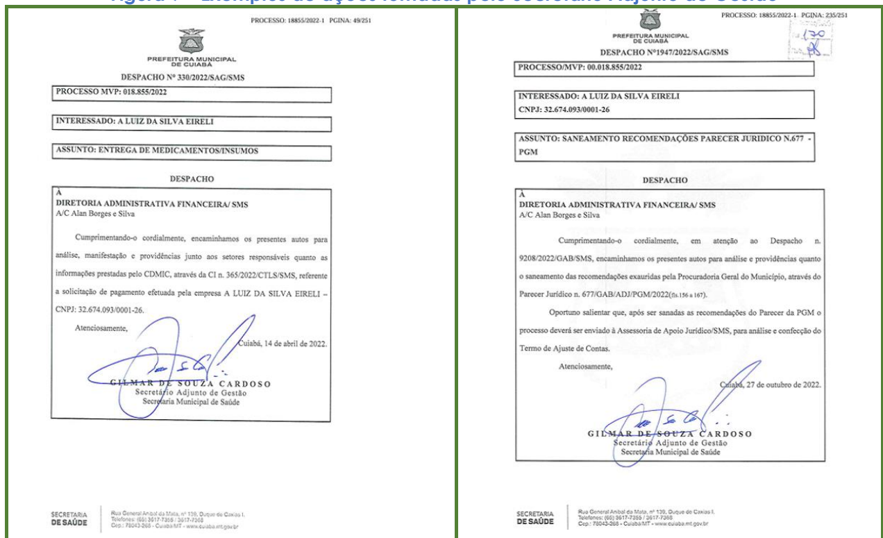
Figura 9 – Exemplos de ações tomadas pelo Secretário Adjunto de Gestão

219. Conforme evidenciam os documentos abaixo – extraídos dos processos de despesas indenizatórias analisados pela Equipe Técnica – o então gestor, inserido no cargo de Secretário Adjunto de Gestão, praticou atos e emitiu despachos, seja solicitando a tomada de providências, seja solicitando orçamento para a emissão de empenhos atinentes aos termos de ajuste de contas formalizados com as empresas fornecedoras, conforme se demonstra: