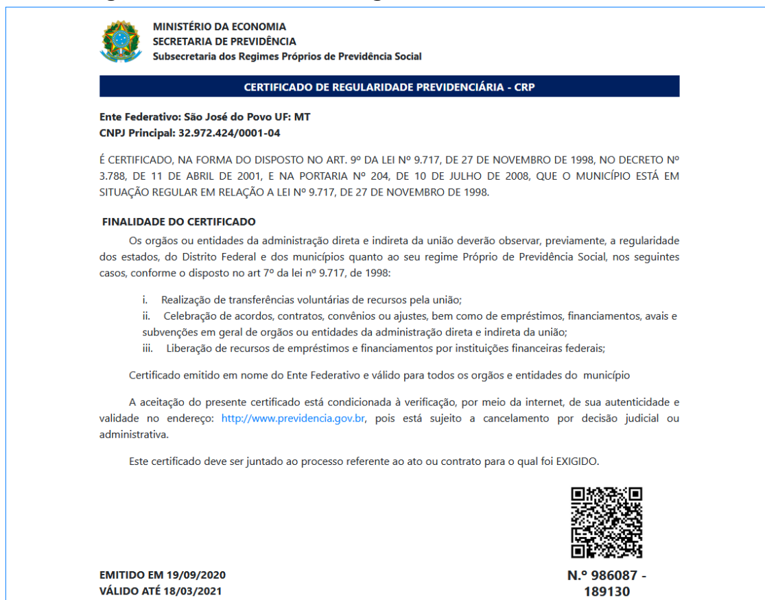
Figura 3 - Certificado de Regularidade Previdenciária CRP

Na análise das informações extraídas em 30/04/2021, no endereço eletrônico da Secretaria de Previdência 1 , constatou-se que o Município de São José do Povo, por meio do CRP nº 986087-189130, encontra-se IRREGULAR, com o Certificado de Regularidade Previdenciária (via administrativa), desde 19/03/2021.