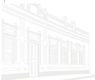
Casa Barão de Melgaço - 1ª Sede 1953

TOTAL DE GLOSA PENDENTE: R$ 0,00 // IPCA: R$ 0,00