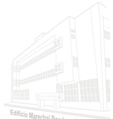
Edifício Marechal Rondon - Sede atual 2013