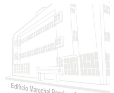
Edifício Marechal Rondon - Sede atual 2013