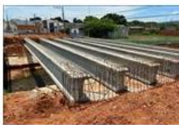
Enviada em: 08/12/2020...