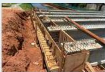
Enviada em: 08/12/2020...