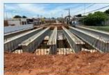
Enviada em: 27/05/2021...

Consta da 4ª medição a liquidação de 100% da mesoestrutura, no entanto verifica-se a execução de 50% das formas (item 1.41.) e 50% armação de aço das travessas (item 1.4.3), pelas fotos não se verifica a concretagem (item 1.4.2) das travessas medidas 100%.