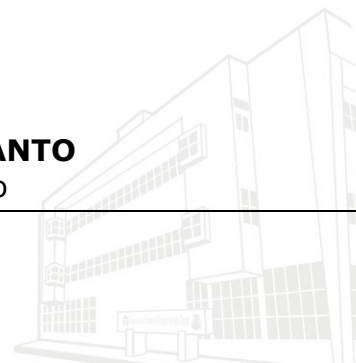
Edifício Marechal Rondon - Sede atual 2013