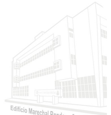
Edifício Marechal Rondon - Sede atual 2013