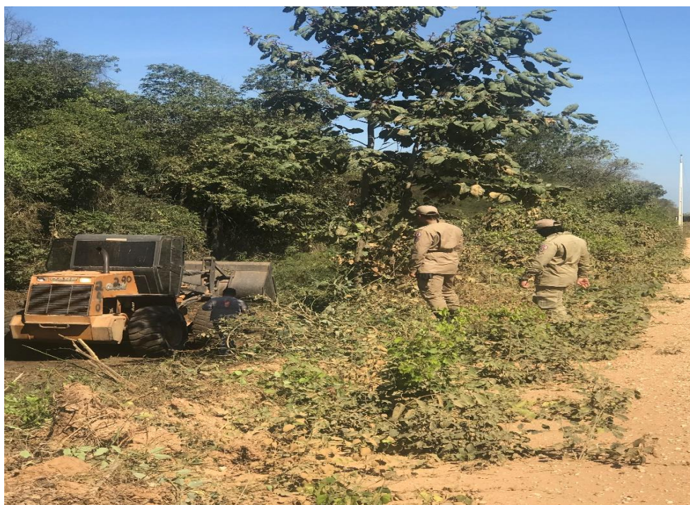
Foto 4. Bombeiros acompanhando a realização de aceiro mecânico km 80 da Transpantaneira

Dessas observações diretas restou comprovado : ausência de manutenção das máquinas pesadas; ausência de assistência rápida aos servidores, bombeiros e maquinários, o que prejudica a efetividade das ações a serem executadas em tempo (FASE PREPARAÇÃO); bombeiros carentes de treinamento e habilidade para operar máquinas pesadas, caracterizando o atraso do governo estadual na adoção de medidas relevantes e eficazes para a prevenção das queimadas, uma vez que em julho inicia a FASE DE RESPOSTA (período em que ocorre o ápice das queimadas).