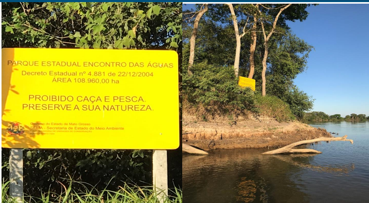
Foto 7 e 8. Margem Parque Estadual Encontro das Águas – Porto Jofre.