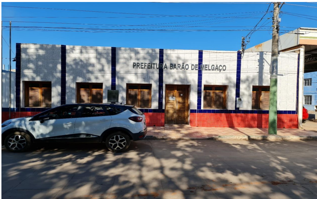
Foto 5. Prefeitura Municipal de Barão de Melgaço.

Foi realizada no dia 15/6 visita ao Município de Barão de Melgaço para entender as ações que o município tomou diante da extensa área atingida pelos incêndios no ano passado.