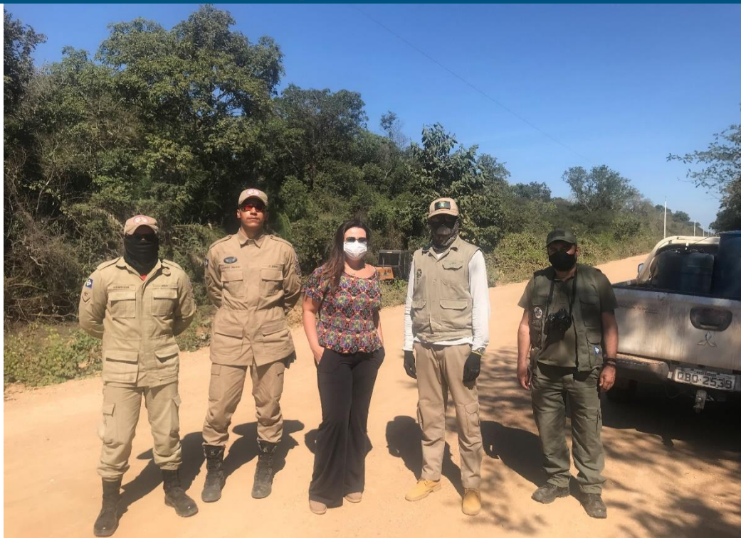
Foto 2. Servidores SEMA/MT, bombeiros militar e auditora no Km 80 da Transpantaneira – Poconé

Foi informado que o Parque Estadual Encontro das Águas conta com 3 máquinas pesadas: 2 pá-carregadeira e 1 esteira, sendo que 1 pá-carregadeira se encontra no limite do Parque com o município de Barão de Melgaço. Para a ação de realização de aceiros mecânicos no km 80 da Transpantaneira – Município de Poconé – contavam apenas com as 2 outras máquinas.