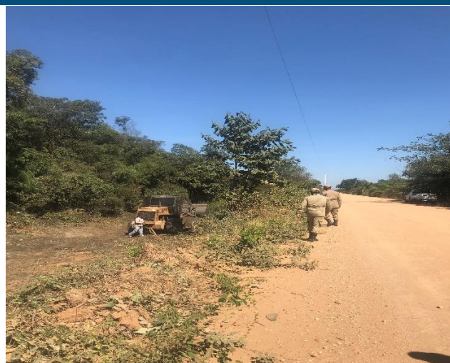
Foto 3 e 4. Construção de aceiro mecânico km 80 Transpantaneira – Município de Poconé

Dessas observações diretas restou comprovado : ausência de manutenção das máquinas pesadas; ausência de assistência rápida aos servidores, bombeiros e maquinários, o que prejudica a efetividade das ações a serem executadas em tempo (FASE PREPARAÇÃO); bombeiros carentes de treinamento e habilidade para operar máquinas pesadas, caracterizando o atraso do governo estadual na adoção de medidas relevantes e eficazes para a prevenção das queimadas, uma vez que em julho inicia a FASE DE RESPOSTA (período em que ocorre o ápice das queimadas).