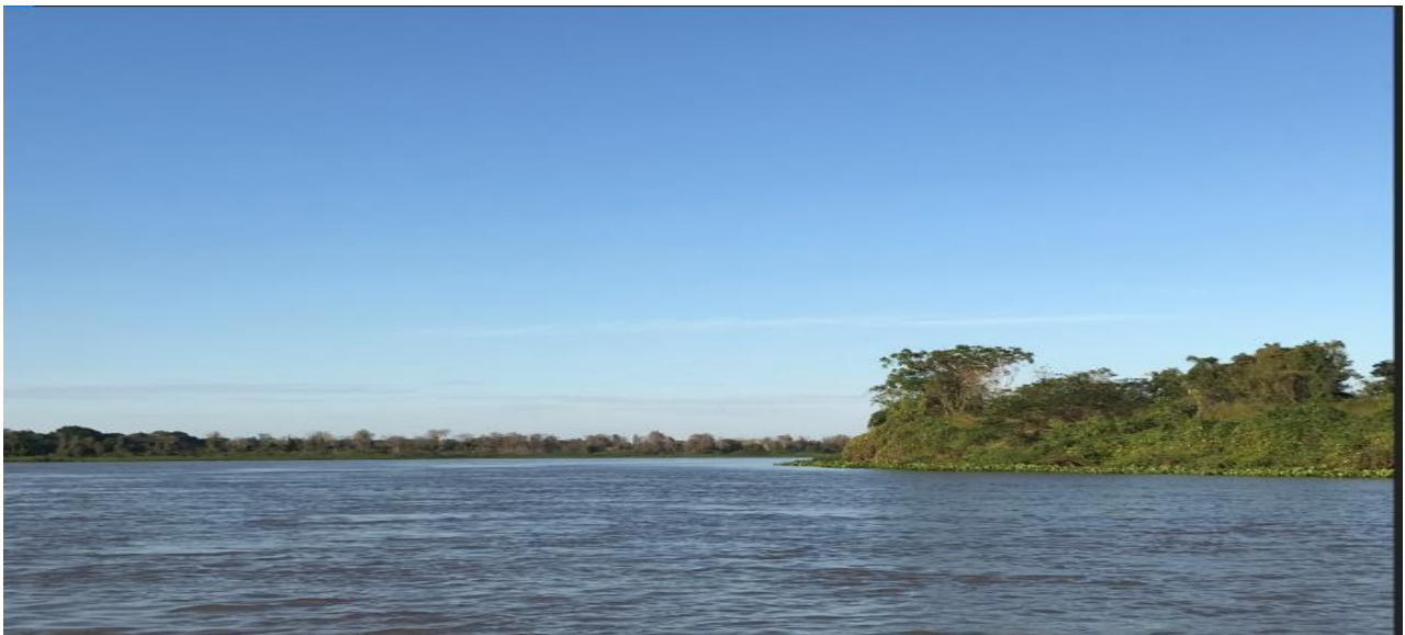
Foto 6. Margem direita Pantanal Mato Grosso do Sul e à esquerda do Mato Grosso

No que se refere ao outro limite do Parque Estadual Encontro das Águas , na região de Porto Jofre – KM 140 da Transpantaneira , que teve ano passado, o incêndio originado no Estado de Mato Grosso do Sul, eis que o fogo veio do estado vizinho e “pulou o rio”, adentrando o Parque e contribuindo para o desastre ocorrido, fomos informados de que estão providenciando o aceiro mecânico e que já dispõe de 1 máquina naquela região para essa ação, contudo, não foi possível naquele momento a inspeção e confirmação dessa ação.