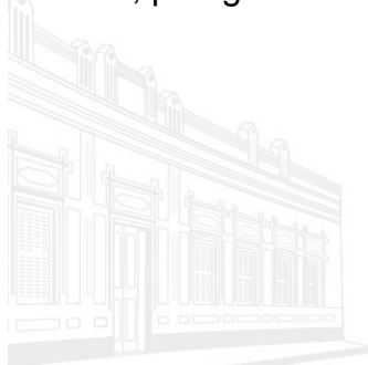
Casa Barão de Melgaço - 1ª Sede 1953

Alerto de que a ausência de manifestação no prazo estipulado implicará a revelia do citado supramencionado para todos os efeitos processuais, conforme dispõe o art. 6º, parágrafo único, da Lei Complementar Estadual 269/2007.