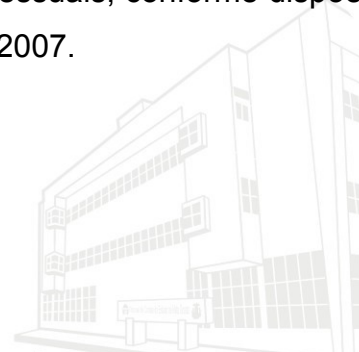
Edifício Marechal Rondon - Sede atual 2013

(Portaria 001/2015, DOC 546, de 15/01/2015)