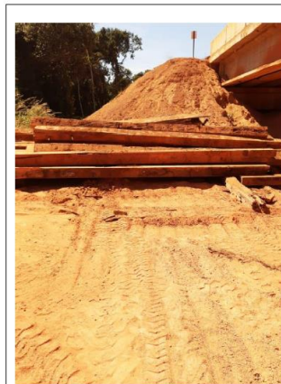
Figura 5 - Quadrados retirados da ponte do Rio Arinos

À esquerda, quadro de serviços contratados pela prefeitura de Tapurah, contrato nº 43/2020.