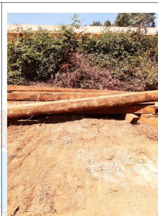
Figura 6 - Quadrados retirados da ponte do Rio Arinos

Fonte: Relatório de Fiscalização em resposta ao Memorando UCCI nº 014/2021/PMT. Nele constam fotos das madeiras retiradas da antiga ponte do rio Arinos.