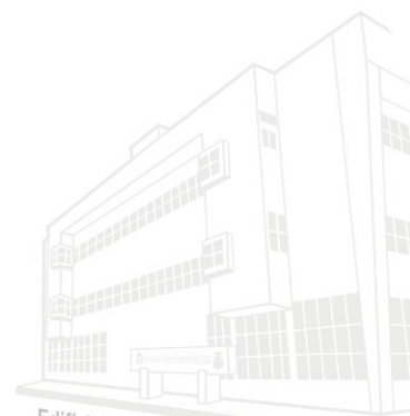
Edifício Mato Grosso Sede atual