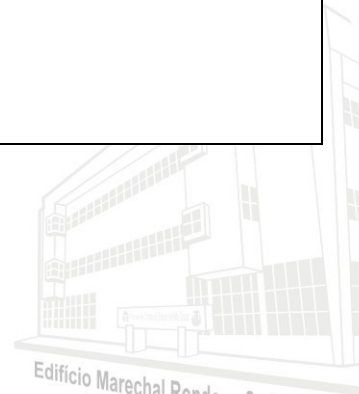
Edifício Marechal Rondon - Sede atual 2013