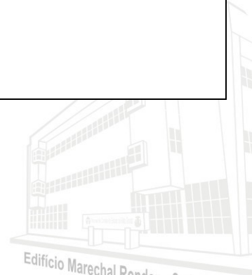
Edifício Marechal Rondon - Sede atual 2013