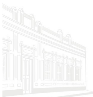
Rua Barão de Melgaço - 1ª Sede 1953