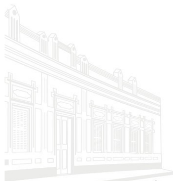
Casa Barão de Melgaço - 1ª Sede